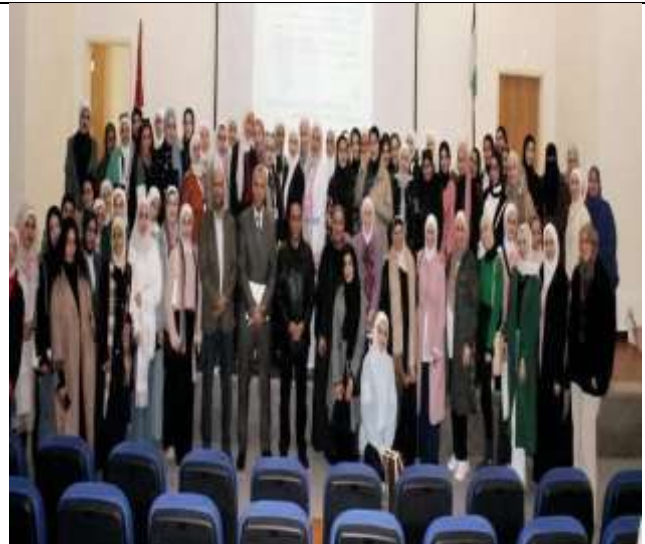
A lecture entitled (Practical Life Skills and Self-Development)