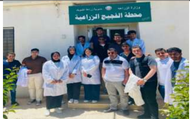
Practical and field activities for Veterinary Care students at Shobak University College