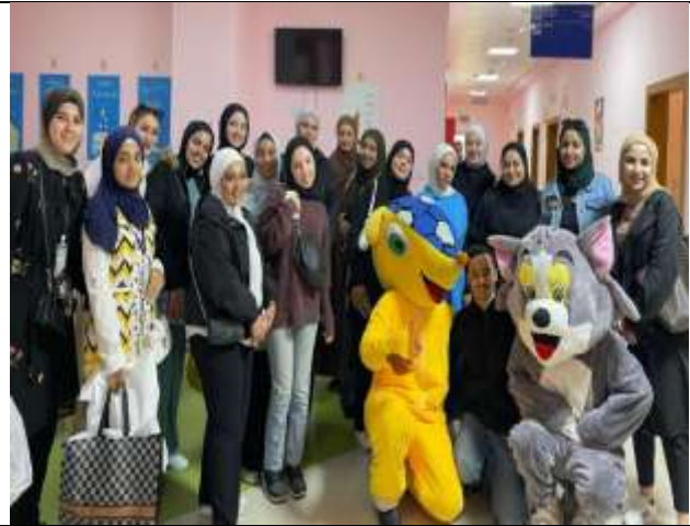
Princess Rahma University College students organize an initiative for children at Al-Salt Hospital