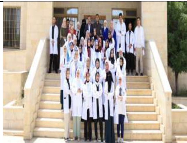
Pharmaceutical Scientific Day