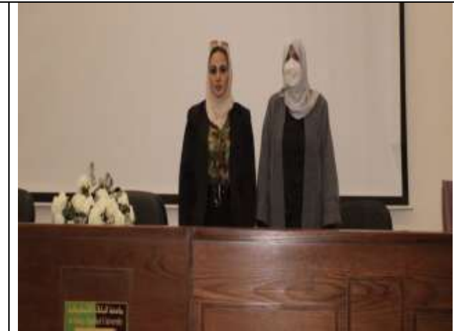
A lecture entitled "A Dose of Optimism"