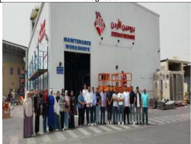
Scientific visit to the bromine plant