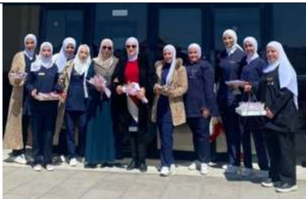
Karak University College students celebrate Mother's Day at Karak Government Hospital