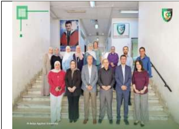
Training workshop entitled (Entrepreneurship and Developing Entrepreneurial Thought in the Work Environment)