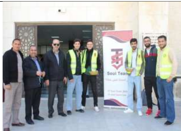
Charity parcels campaign