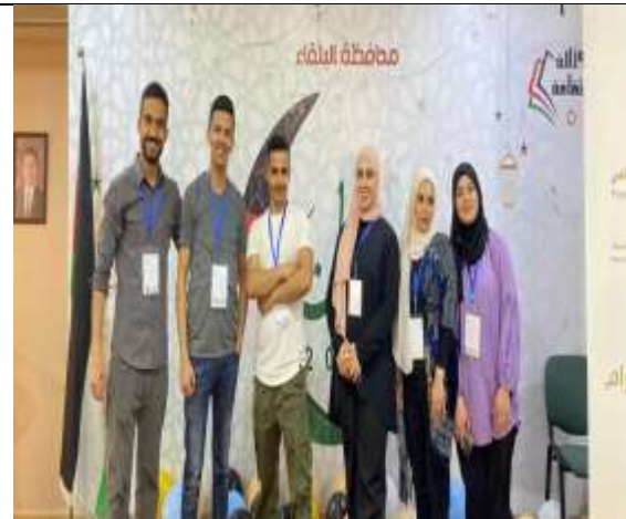
Ramadan charity iftar for children