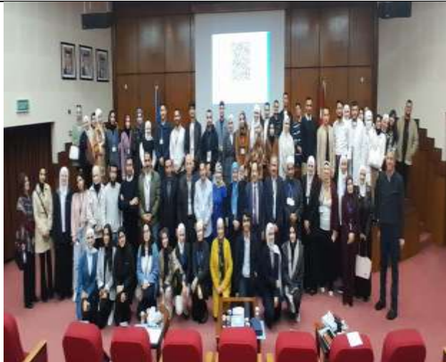
A team of students participated in the Health Ambassadors workshop.