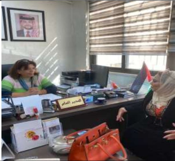
Voluntary visit to the guest house for the elderly