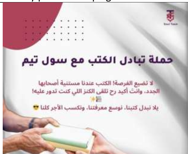
Book exchange campaign