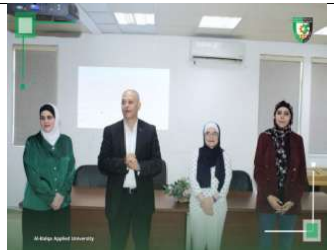
Training course entitled (Beginner Sign Language for the Deaf and Deaf-Blind)