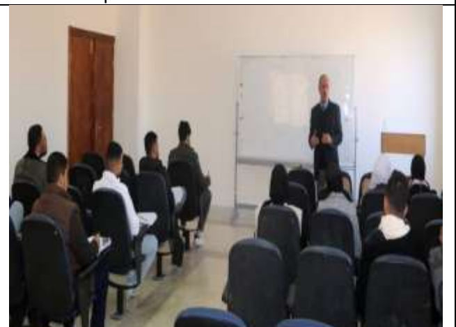
(Tax Expert) Course at Amman University College