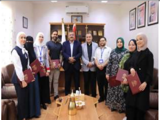
Training of trainers course