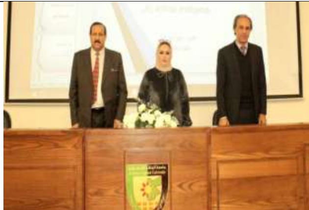
A Lecture : (Artificial Intelligence and its Applications)