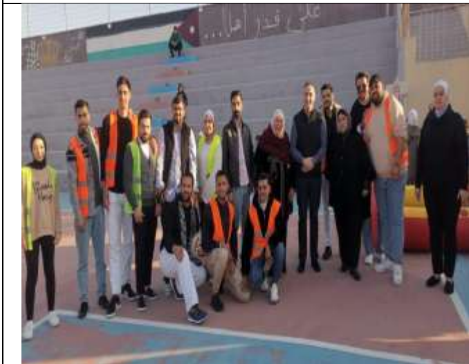
Ramadan Iftar Banquet for Orphans