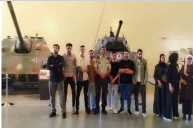
A scientific and educational visit to the Royal Tank Museum in Amman