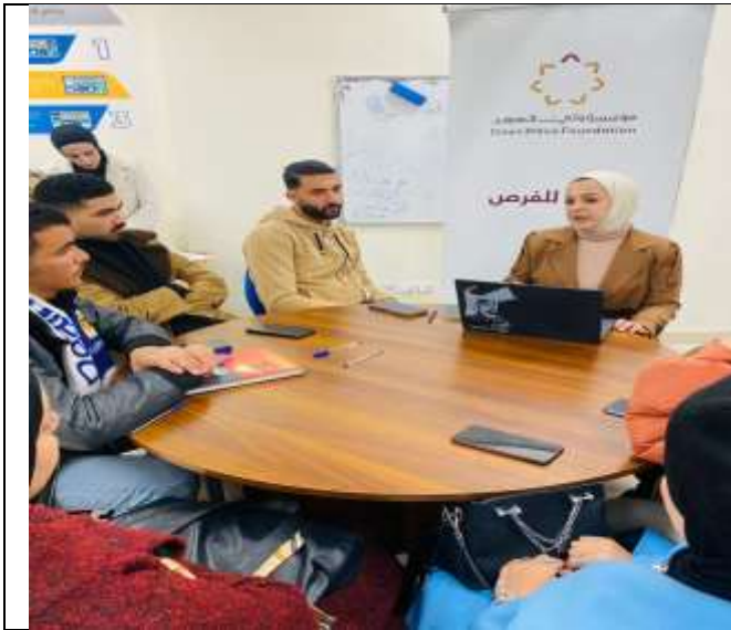
A discussion sessions at Ajloun University College to promote innovation and technology