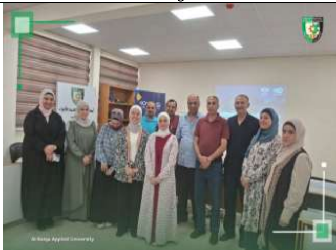
Training workshop on artificial and emotional intelligence tools in scientific research