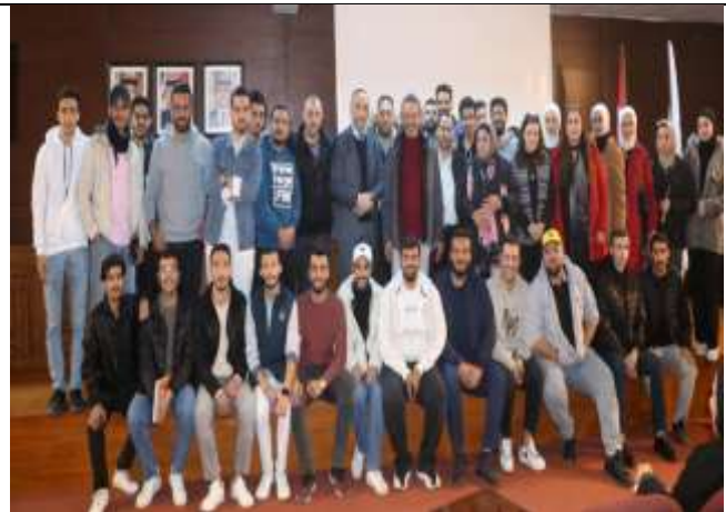
A dialogue session entitled (Principles of University Life)