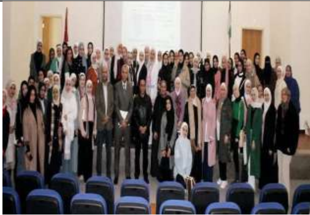
A Lecture : (Practical Life Skills and Self-Development)