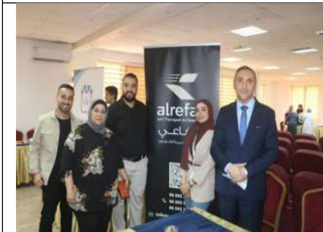
Career and Scientific Day at Amman University College