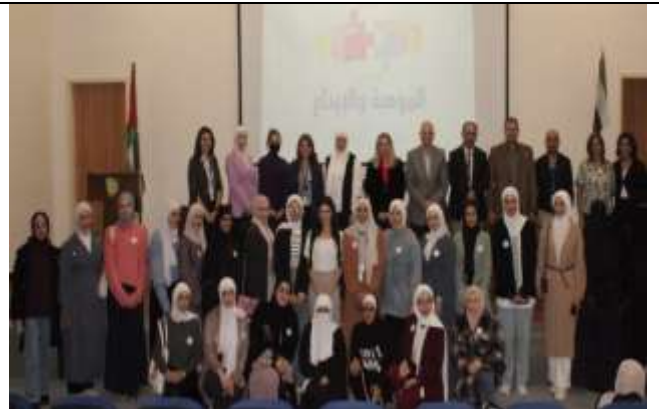
Student event entitled (The World of the Talented)