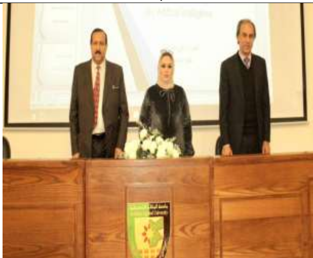
A lecture entitled (Artificial Intelligence and its Applications)