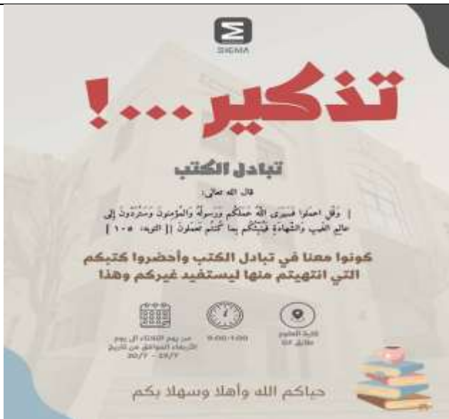
Book Exchange Campaign