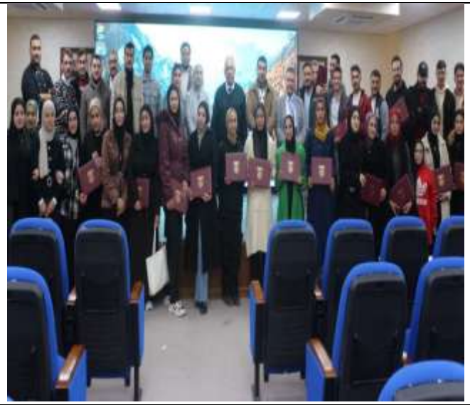
A training course entitled (CV Writing and Job Interviews) for students of Ajloun University College