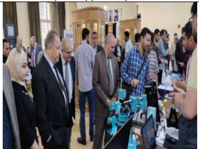
A scientific day: (World Engineering Day for Sustainable Development Goals)