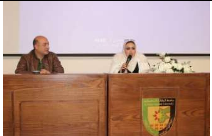
A Lecture :(Digital Video Content Creation)