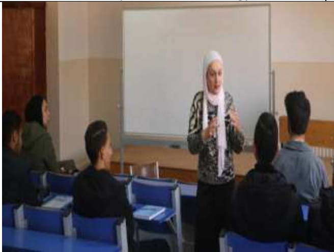
Free workshop to improve English language