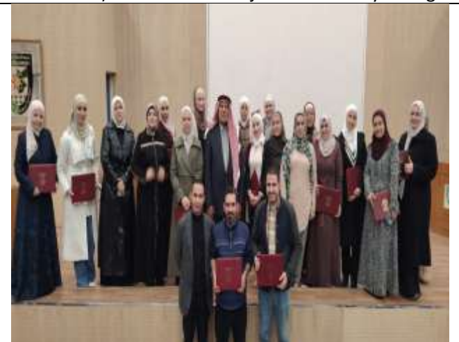
Training workshop entitled (Learning Sign Language for the Deaf and Mute)