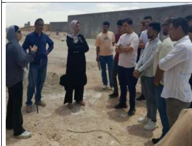
A scientific visit to the project to build a semi-Olympic swimming pool in Karak