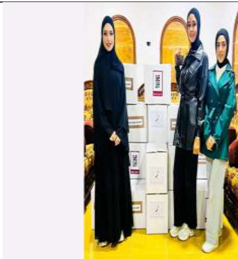
Distribution of food parcels and a charitable Ramadan breakfast to orphaned children