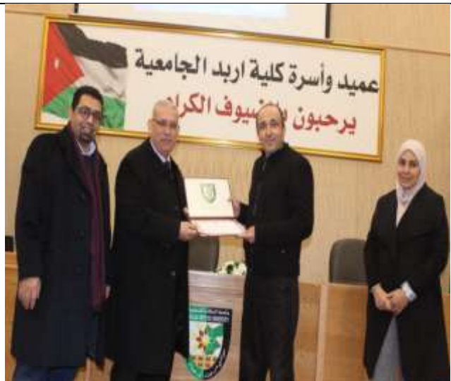
Workshop (Cosmetic Pharmacy and the Secrets of Mixing Drug Injections)