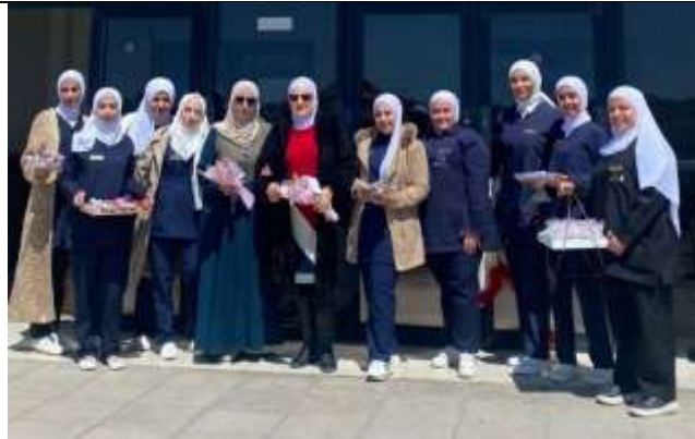
A visit by students from Shobak University College to the Petra Comprehensive Center for Inclusive Commercial Services for People with Special Needs