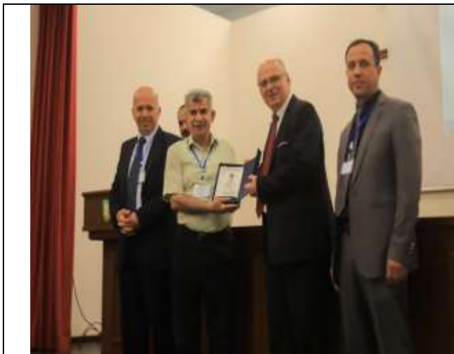
Scientific Day of the Department of Nutrition and Food Processing