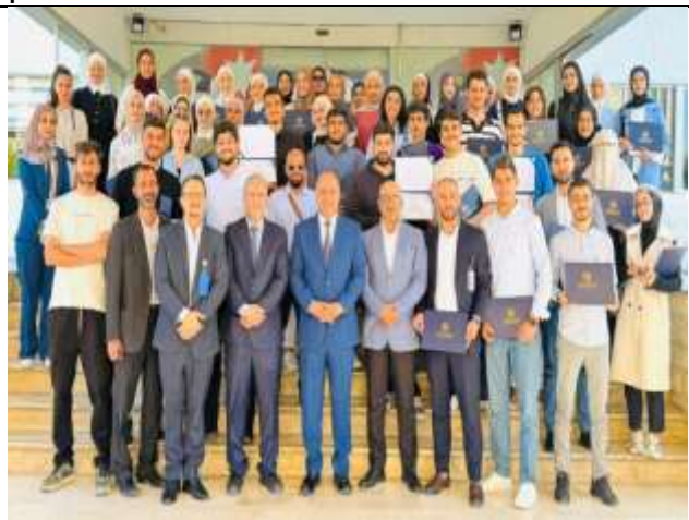
A team of students participated in a specialized training course in the field of nuclear security