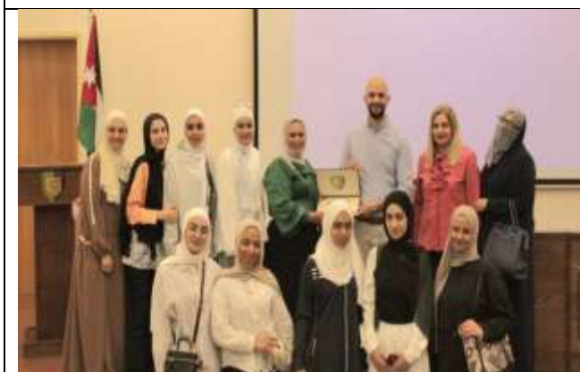
Lecture entitled (Applied Behavior Analysis from Theory to Practice)