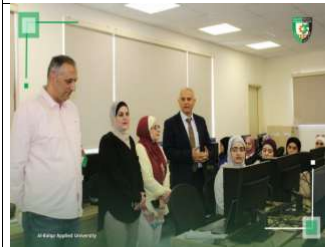
Training course : (Python Programming Basics)