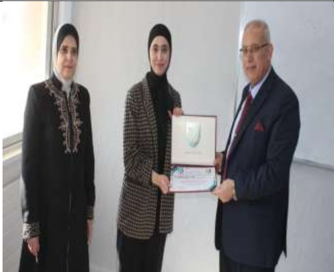
Training course for students of Al-Huson University College