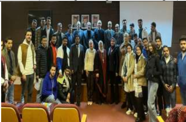
A scientific day entitled (The Jordanian position in supporting Gaza)