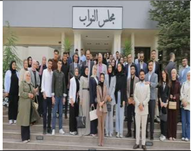
A delegation of students from Al-Huson University College visited the Jordanian Parliament.