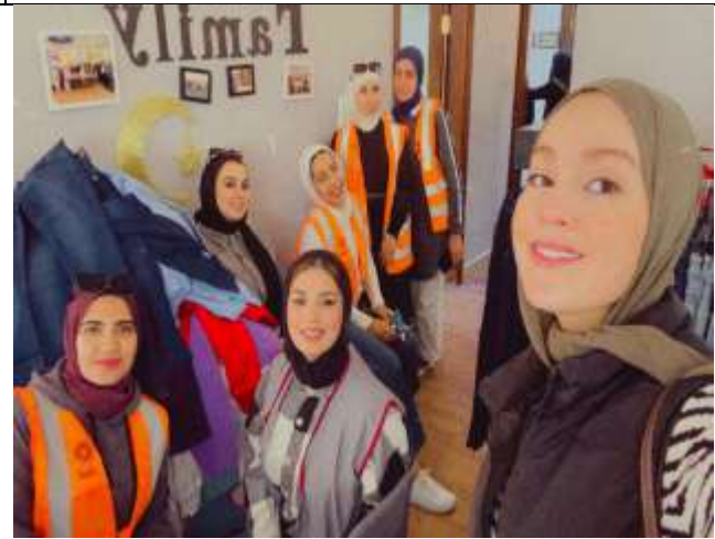
Princess Rahma University College students carry out Ramadan initiatives in cooperation with the Bab Al Khair Volunteer Association