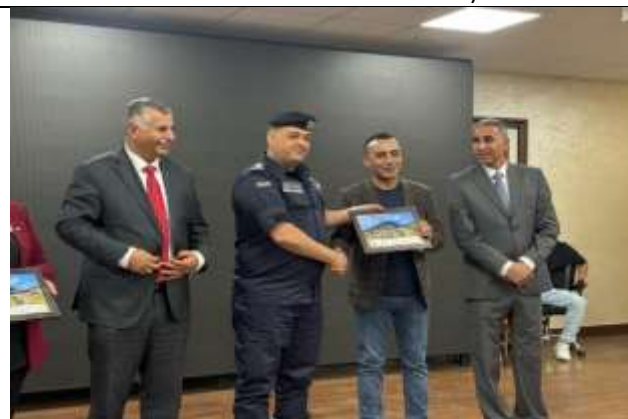
Anti-drug awareness day under the slogan: No to drugs, yes to life