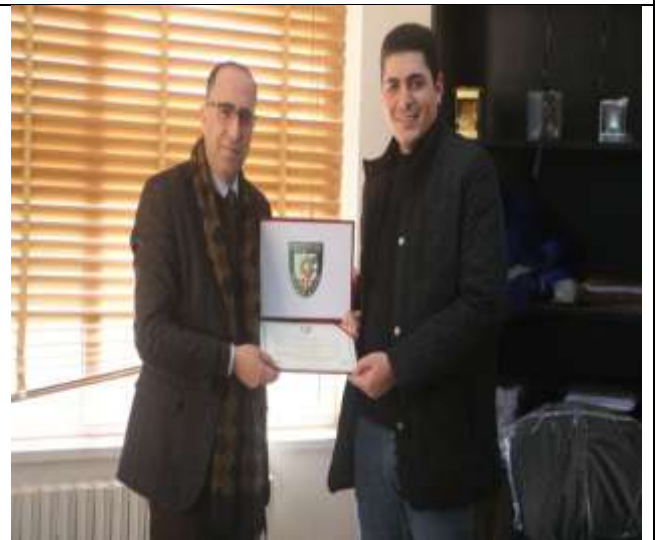
Free training workshop on creating and developing a professional LinkedIn account