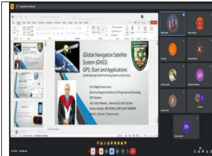
Training workshop on the Global Navigation Satellite System