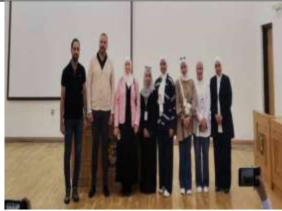
Awareness lecture on drugs