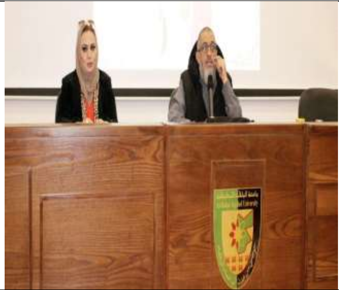
An awareness lecture entitled "A Strong Woman for a Strong Society and a Strong Nation"