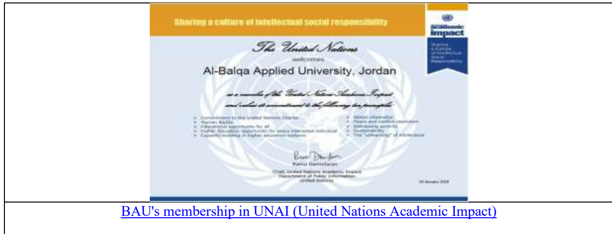
BAU's membership in UNAI (United Nations Academic Impact)