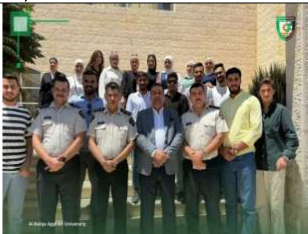
Amman University College students visit the Customs Training Directorate.