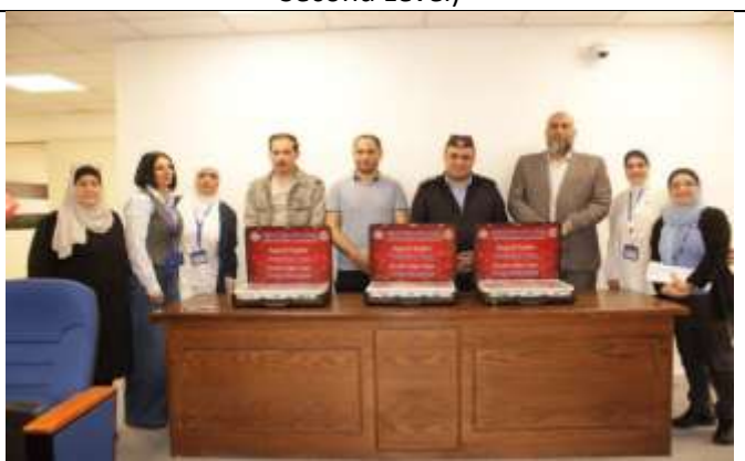
A lecture entitled (The Scourge of Drugs and Its Prevention)