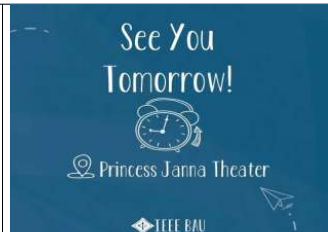
IEEE Day Events