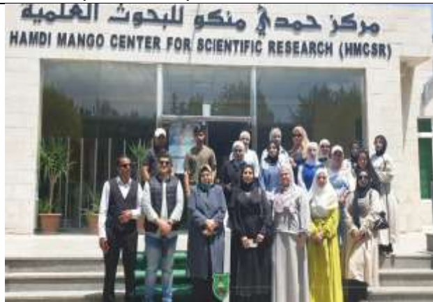
Shobak University College students visit the Hamdi Mango Center for Scientific Research at the University of Jordan