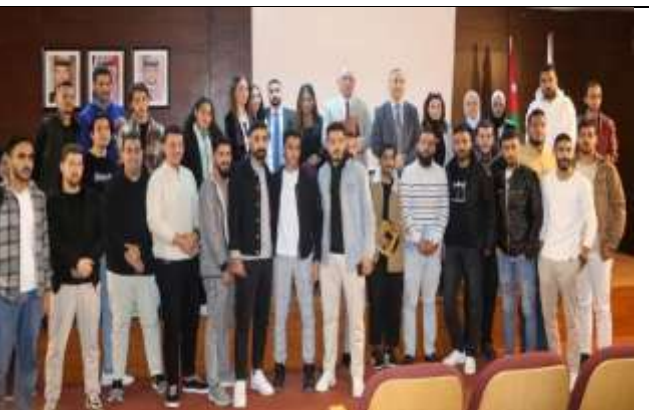
Training Workshop: Practical Application of Trading in Financial Markets and the Importance of Technical Analysis