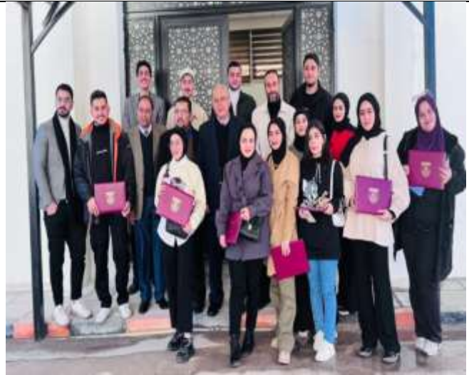
Training course for students of Al-Huson University College