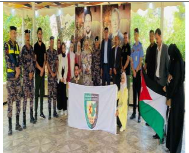
Scientific Day of the Department of Applied Sciences