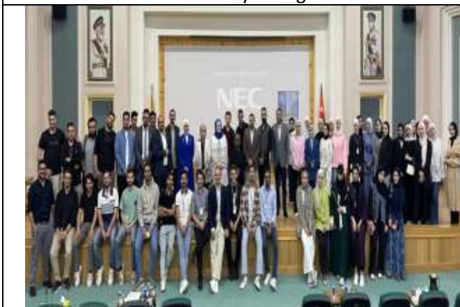
Scientific Day for Chemical Engineering Students at the College of Engineering Technology