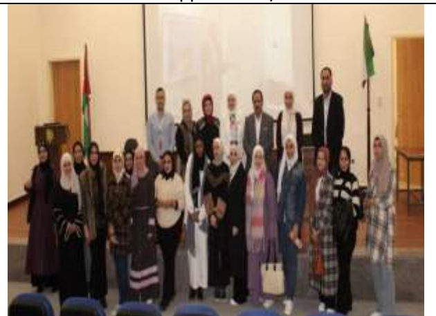
Training workshop: (Creating a CV and conducting job interviews)