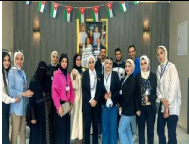
Volunteer work students at Princess Rahma University College organized a visit to the White Family Home for the Elderly