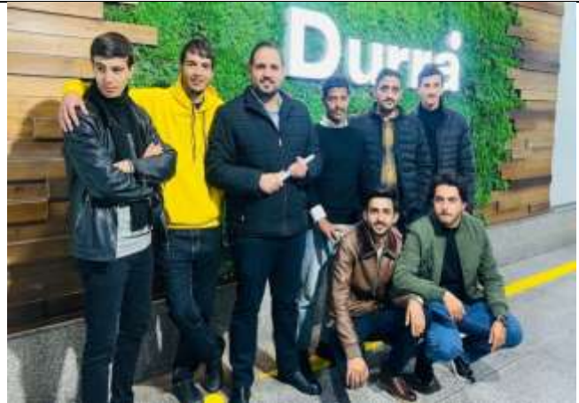
A scientific trip to the Al-Durra Food Products Factory