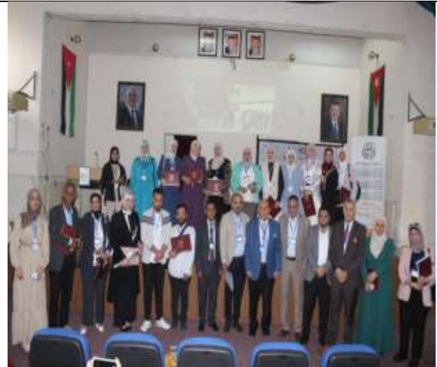
Academic Departments' Scientific Week