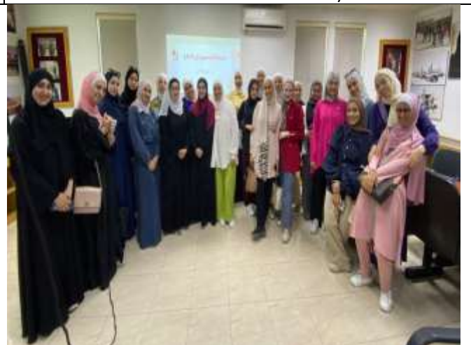
Training course : (Montessori Philosophy in Education, Second Level)