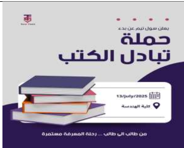
Book exchange campaign