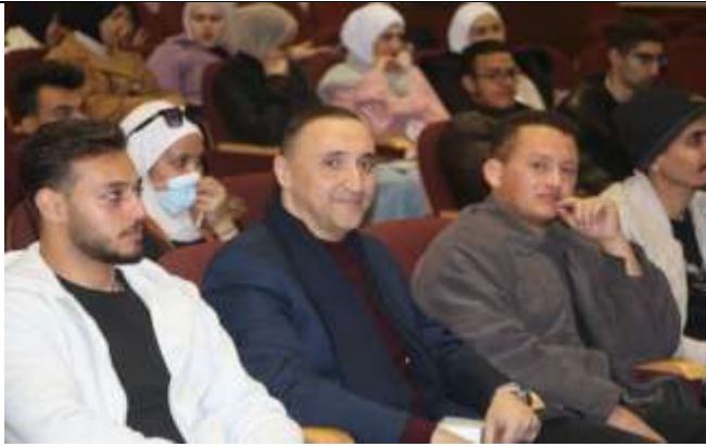
An awareness seminar at Amman University College entitled (The Scourge of Drugs and Their Dangers)