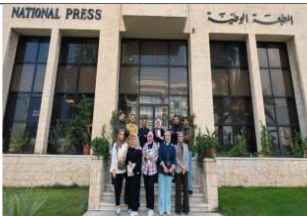
Students from the Salt College of Humanities visit the National Printing Press.