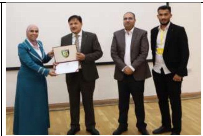
A religious lecture entitled (Like One Body)