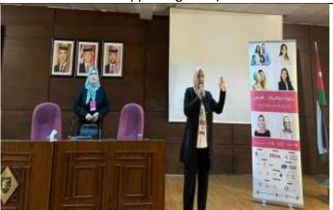
A lecture at Amman University College on the importance of early detection of breast cancer.