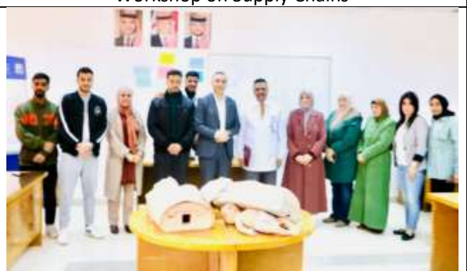
Voluntary workshop entitled (CPR)