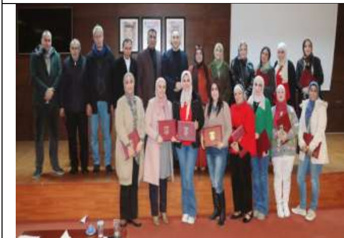
Training workshop entitled (Basics of Sign Language)