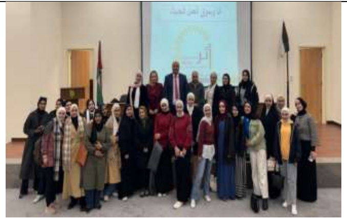
A training program : (Me and the Labor Market)