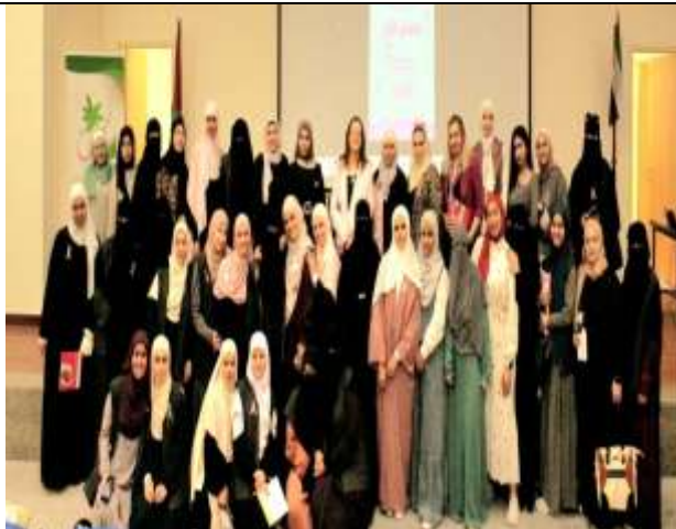
(Step towards life, check) activity