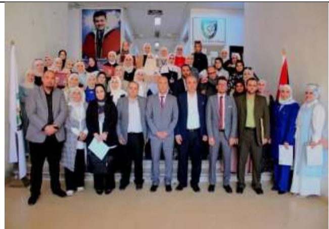
A scientific day entitled "Science: Content and Application"