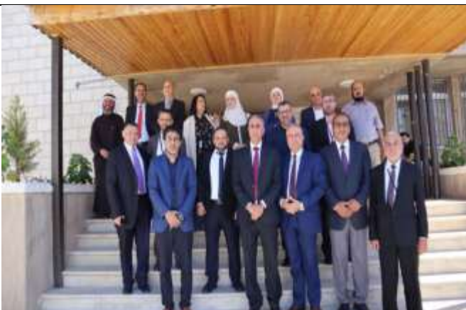
A scientific day :(Early Childhood: Reality and Challenges)