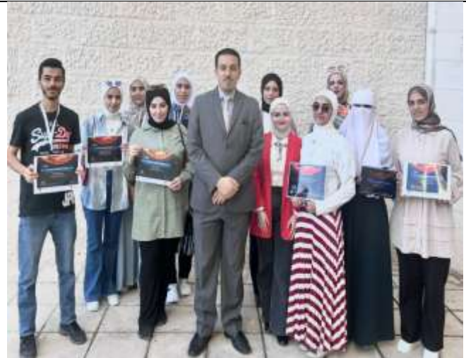
Students from the Faculty of Science at Al-Balqa' Applied University participate in the NASA Space Apps Competition.