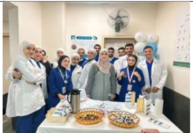
An educational awareness day at Prince Hussein bin Abdullah Hospital