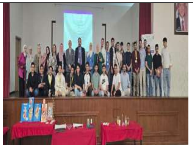
Scientific Week at Al-Huson University College