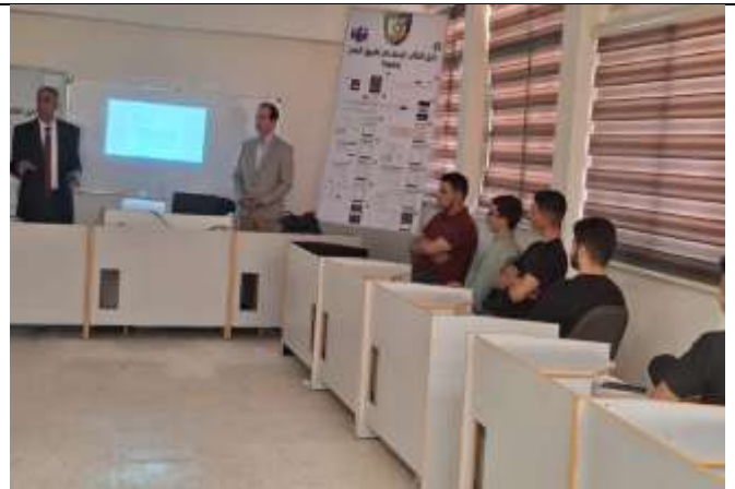
Training session on writing a CV in English