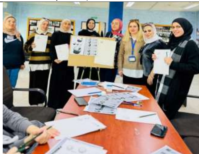
Workshop on (Teaching the Principles of Drawing with Pencil)