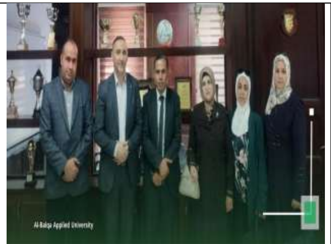
Training workshop entitled: (The Impact of Artificial Intelligence on Developing Professional Writing in the Business Sector: The CV as a Model)