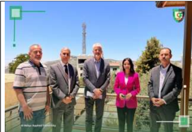
A dialogue session at Ajloun University College entitled (Sports and Technology)