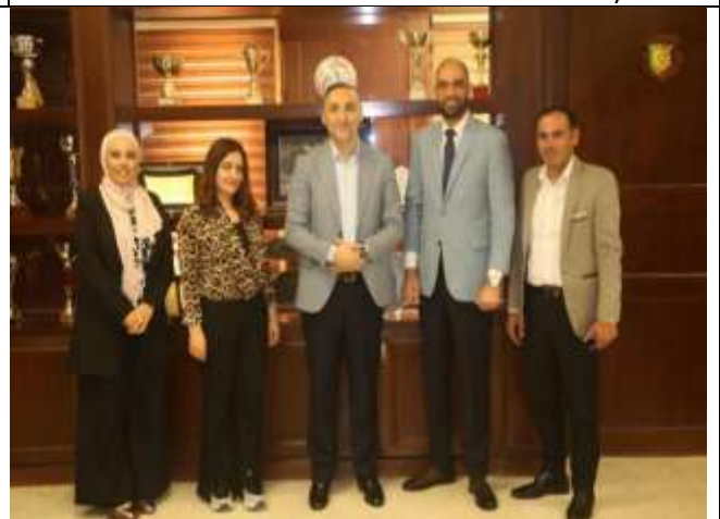
Workshop on Supply Chains