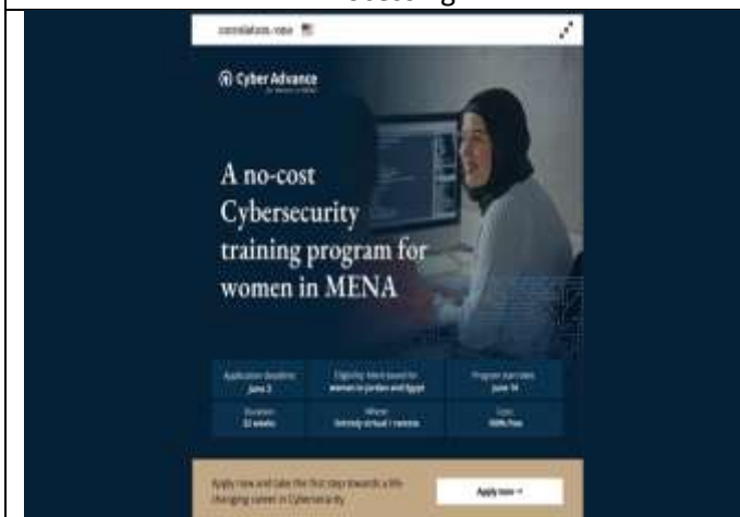
Training course for female students of Al-Huson University College