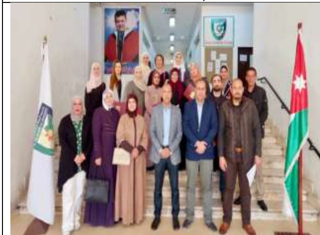
Sign language training workshop