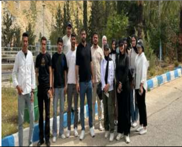
A delegation of students visits Miyahuna Company and the Balqa Applied Science Center for Excellence in Water and Environmental Technology.