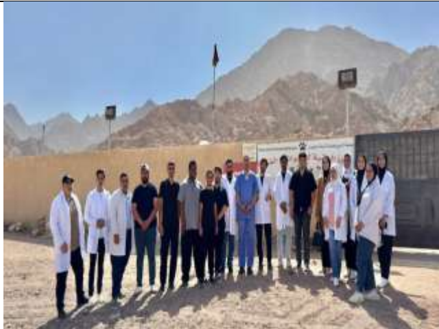
Scientific visits to enhance practical skills in the field of veterinary care