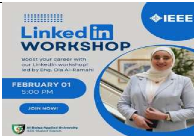
A free, interactive workshop designed for students and professionals