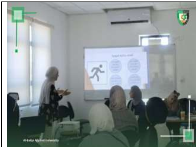
Workshop entitled (Self-Reset)