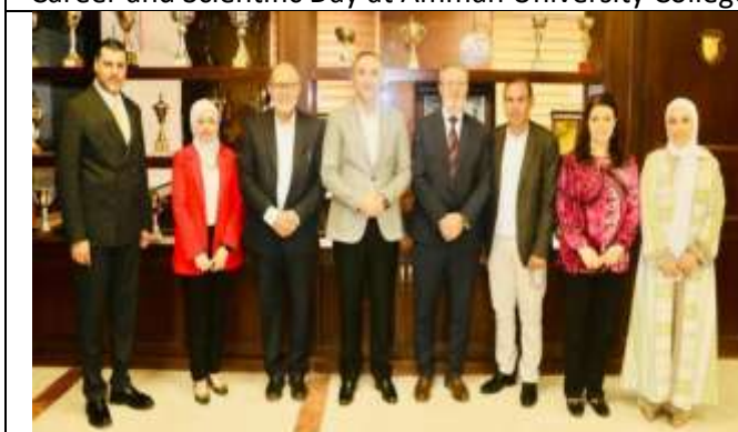
An introductory workshop entitled (Start)