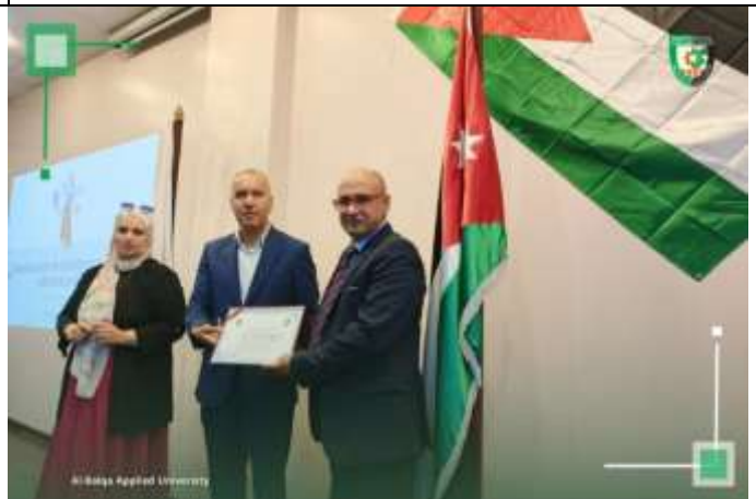
A Lecture :Exploring Creative Entrepreneurship in Medical Specialties