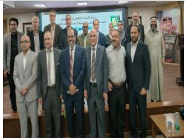
A scientific day on (Interpretation in Language, Literature and Islamic Law)