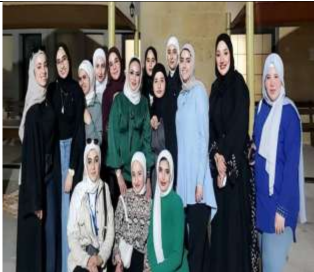
Ramadan Iftar Banquet Initiative (A Moment of Warmth)