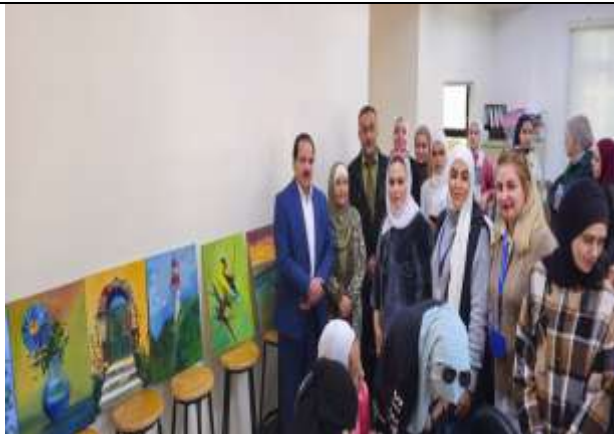
"Brush of Happiness" event at Princess Alia University College