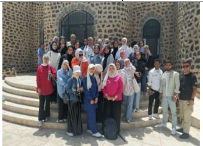
Scientific visit to the Azraq Wetland/Wildlife Reserve