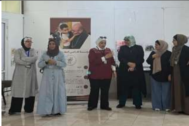
A specialized course in sign language.