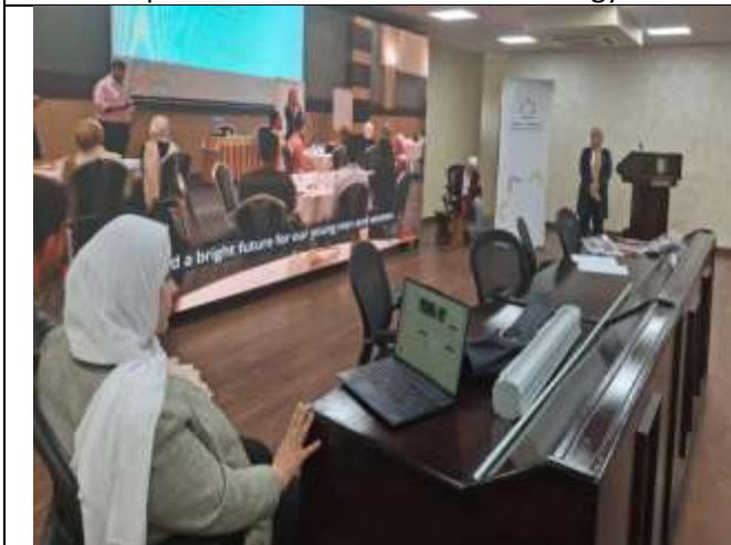
Community Entrepreneurship Workshop at Ajloun University College