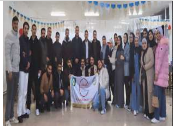
Ramadan iftar for orphans