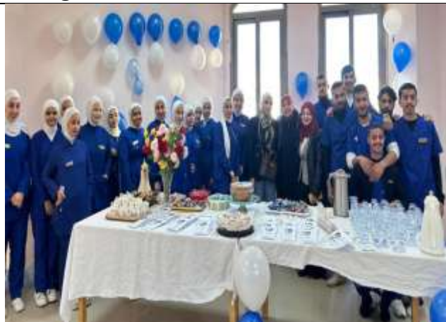
Awareness activity about high blood pressure