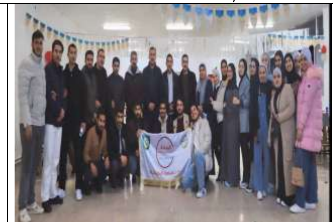
Ramadan iftar for orphans