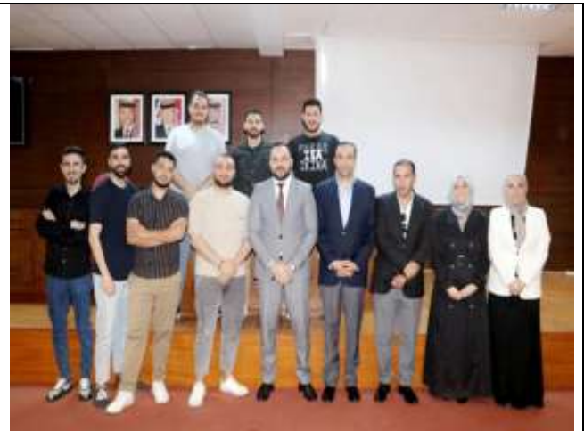
An educational lecture entitled "Spreading the Culture of Excellence"