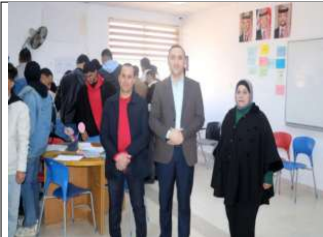
Book Basket Initiative at Amman University College