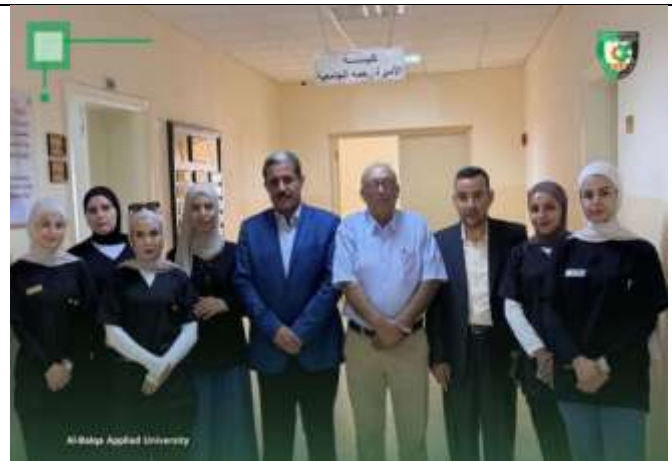
Specialized workshop on psychological and mental diagnosis