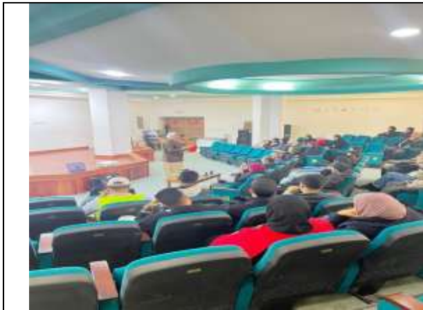
New Horizon event