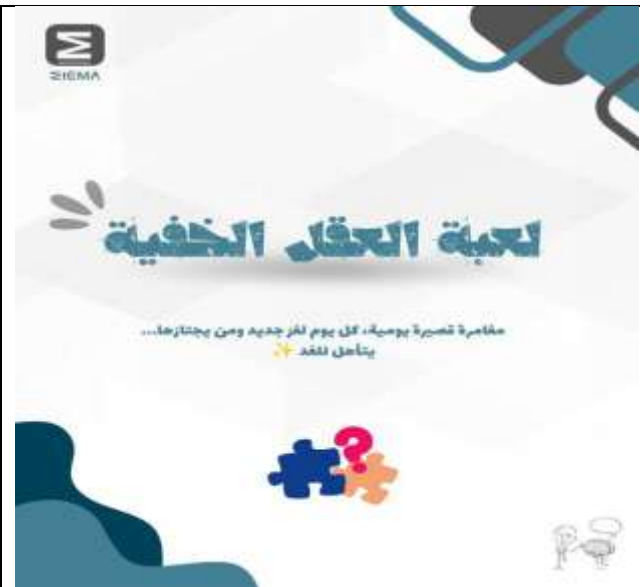
Room of Symbols - Hidden Mind Game