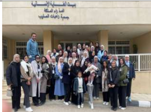
Princess Rahma University College students visit the Human Care Home for the Elderly