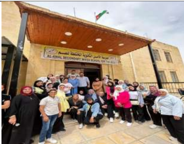
Students of Princess Rahma University College celebrate Deaf Week at Al-Amal School for the Deaf