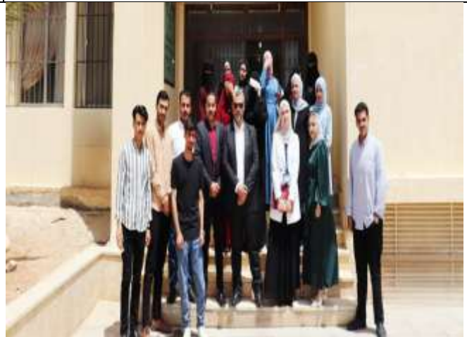
A qualitative scientific visit to the Aqaba Railway Company