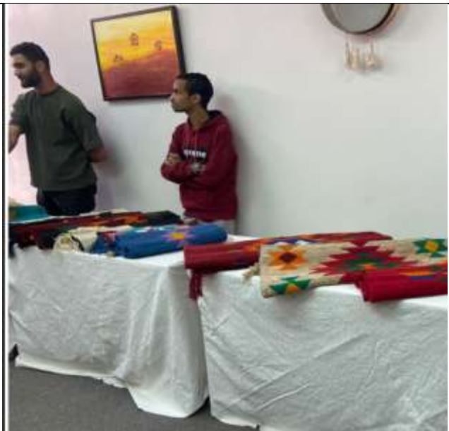
Sample of Nabd Club for Students with disabilities' activities