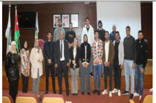
Training program on the basics and logistics of finance and business