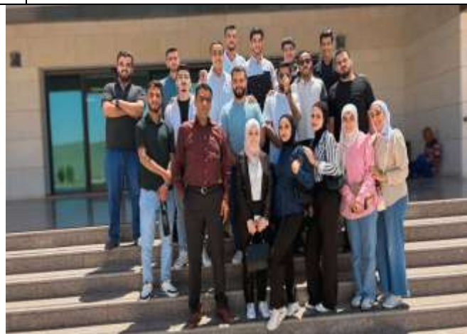
Amman University College students visit Amman Customs Directorate