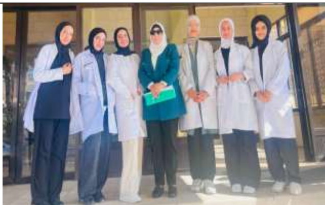
Princess Rahma University College students visit the National Center for Mental Health Hospital