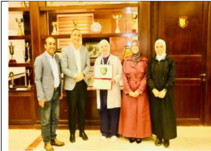
Educational lecture: (Health care and lifestyle)