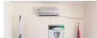
جائزة أفضل فريق تدريبي