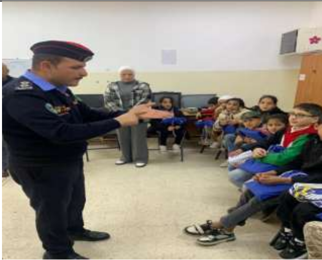
An Awareness lecture "Public Safety" at Al-Amal School for the Deaf and Mute.