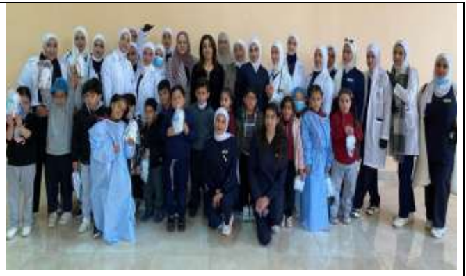
(Little Nurse) workshop to promote health awareness in schools