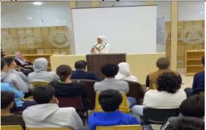
Awareness Seminar (Learning Difficulties and Psychological Counseling) in Coventry Schools