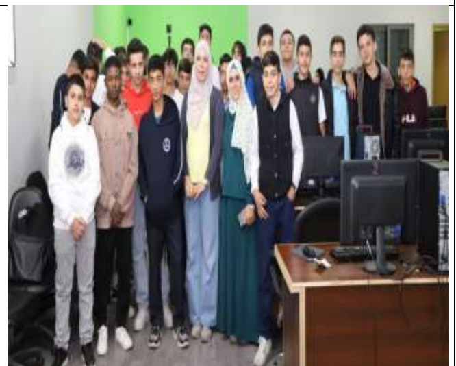
An introductory visit from Al-Iman Islamic Schools to Al-Balqa Applied University