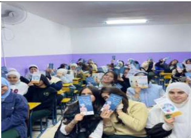
An Awareness lecture on Seasonal Diseases at Al-Salt Private Schools.