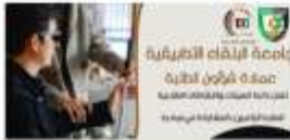
جائزة أفضل فريق تدريبي