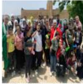
مشاركة حول التعامل مع ذوي الاحتياجات الخاصة