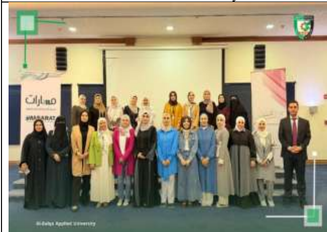
Training (building women's capacities in political participation and party work)