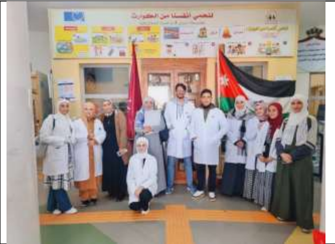
Educational Workshop : "The Little Pharmacist"