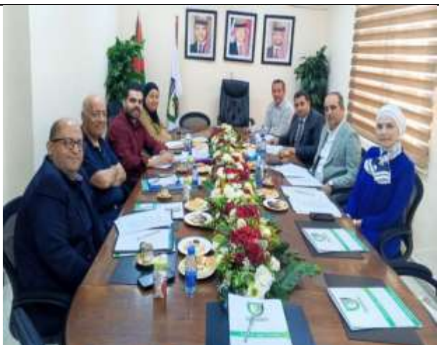
A Specialized Training Program for Engineers and Technicians of Wastewater Treatment Plants of The Ministry of Water And Irrigation.