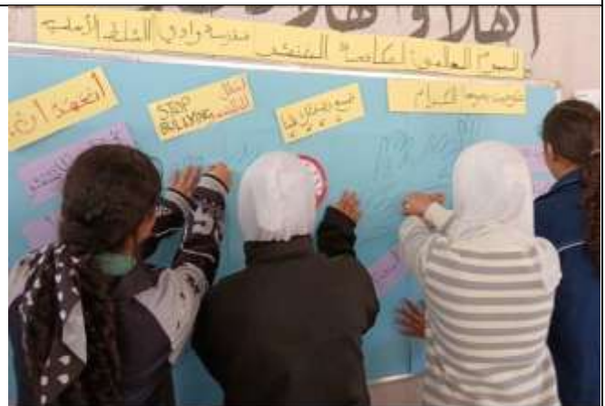
An Awareness Initiative to combat Bullying at Wadi Al-Salt School.