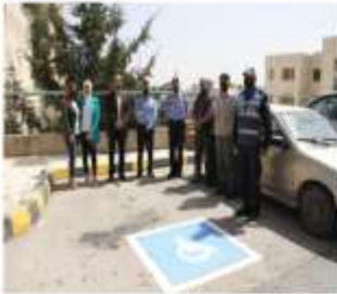
استكمال مشروع مواقف لأهل العزم بالتعاون مع معهد المرور