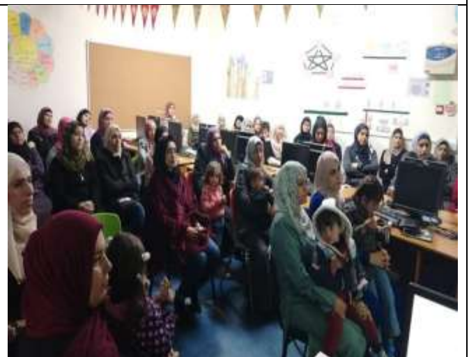
An Awareness Lecture by Princess Rahma University College Aat Umm Al-Amad Elementary School