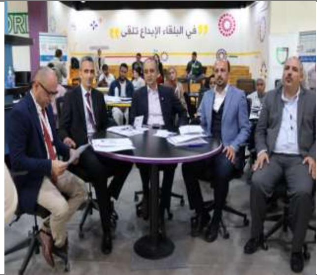
Launch of the training workshops for the Balqa Green Innovation Hackathon 2025