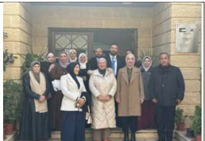
An awareness lecture : "Financial Inclusion and Loan Management" was delivered to women in Balqa Governorate.