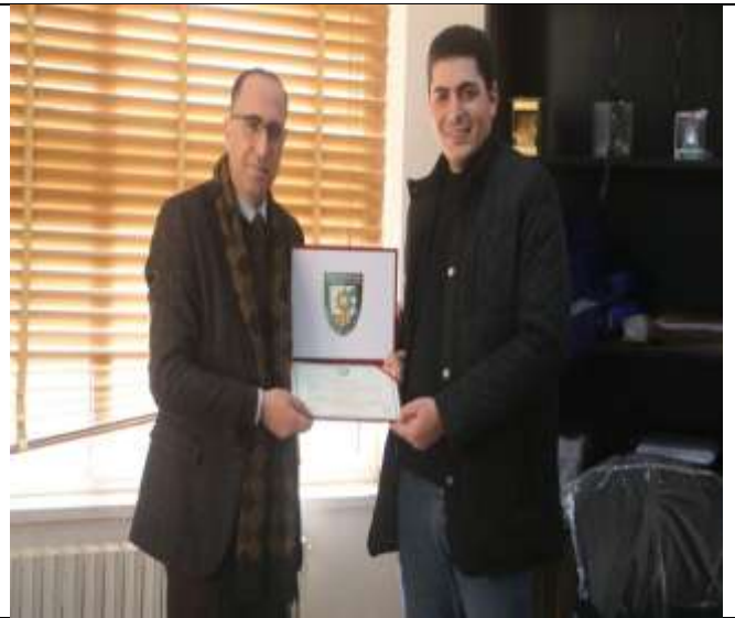
A Workshop on Creating And Developing a Professional LinkedIn Account