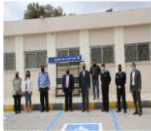
استكمال مشروع مواقف أهل العزم في كلية راحة الجامعة