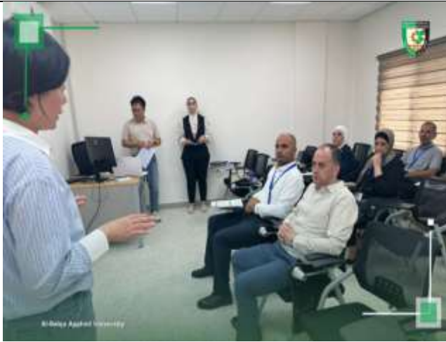
A Korean delegation from KOICA visits the Career Development Center of the Southern Region Colleges and provides advanced training on graduate tracking.