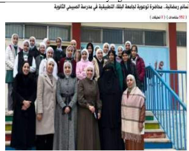
A lecture : Ramadan Breezes at Subayhi School.