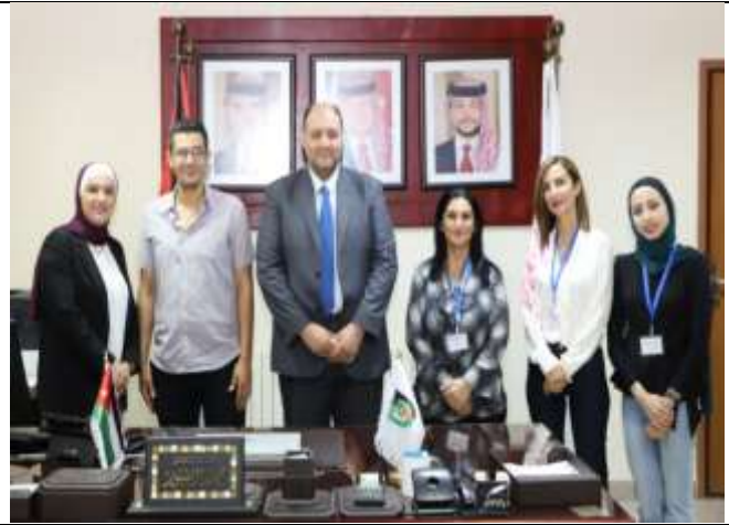
Open Career Day