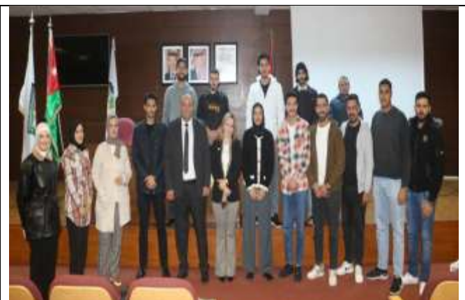
Training Program on The Basics and Logistics of Money