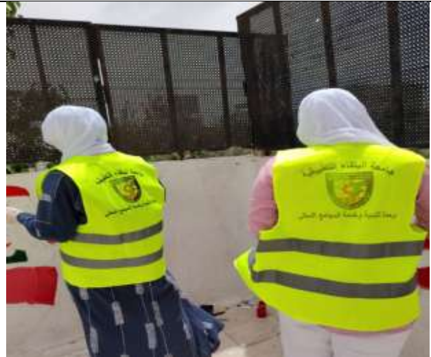
A Mural Painting Activity at Al-Baqaa School.