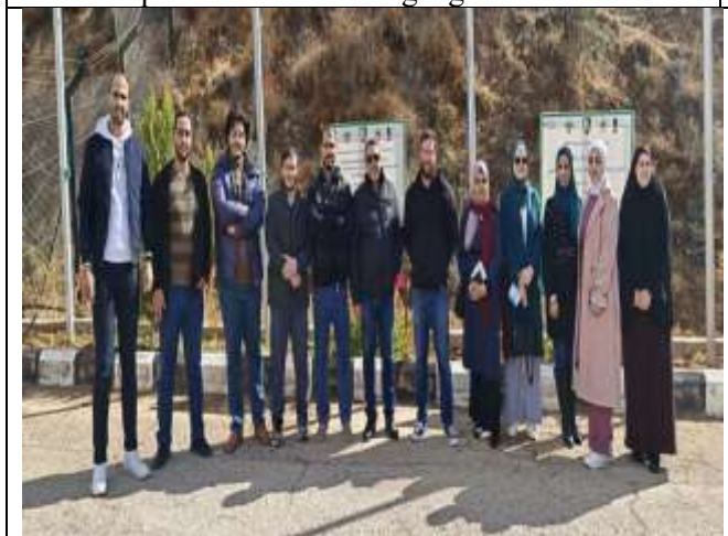
Training Of the Second Batch of the Engineers Syndicate