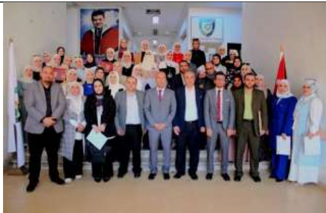
(Science: Content and Application) A distinguished scientific day at Zarqa University College