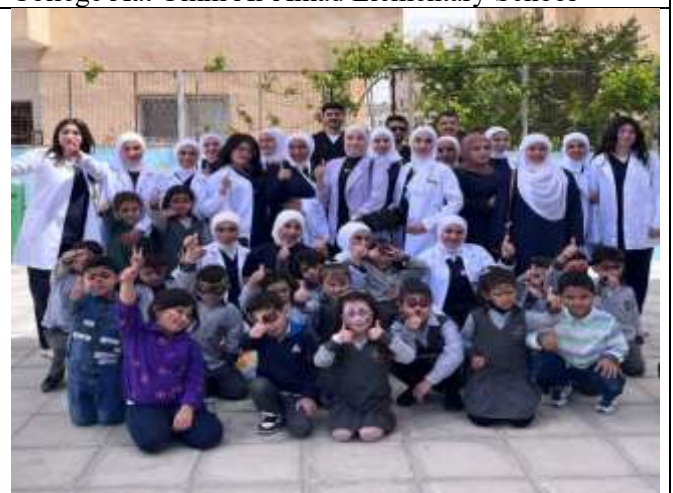
The Brave Hero and the Little Wound Workshop to Promote Health Awareness in Schools