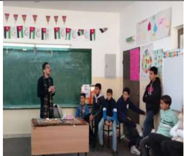
An Educational lecture: My Teeth, My Health at Sumiya Basic Mixed School.