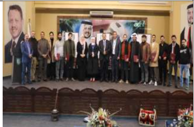
A scientific day at Ma'an College for Chemical Industries Technology