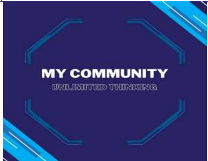
My Community Project – Phase (1)