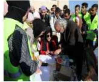
عقد الانعقاد لذوي الإعاقات البصرية