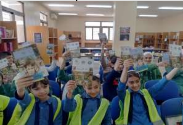
A Training Course : Friends of the Environment at Al-Yarmouk School.