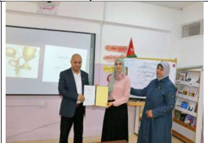
Educational lecture on entrepreneurship