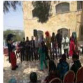
يوماً ترفيهياً للأطفال المعاقين