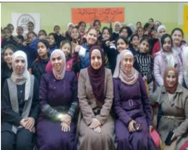
A lecture : Ramadan Breezes at Al-Iman Islamic Schools.