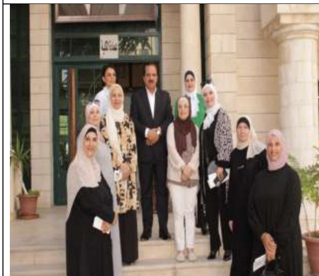
Visit of female graduates to Princess Alia University College