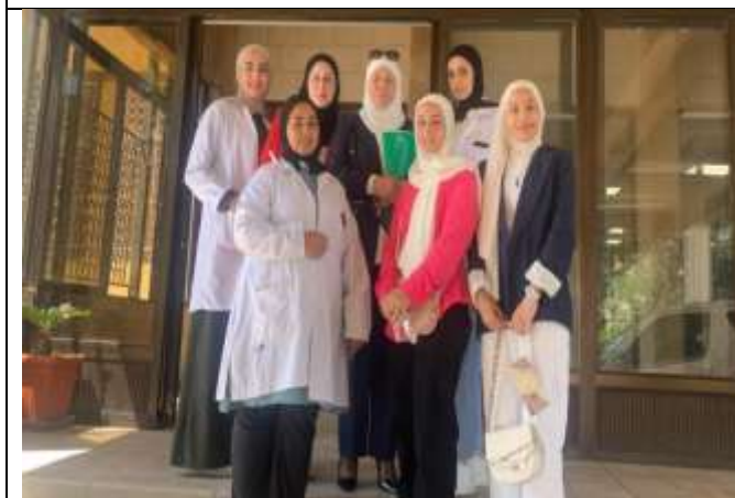
Al-Quds Open University students visit Al-Balqa Applied University