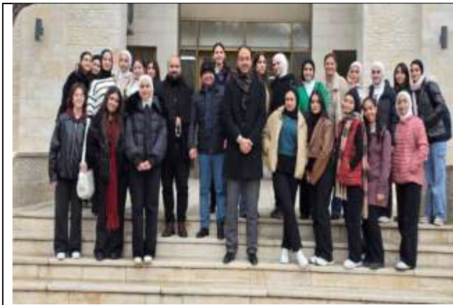
An introductory visit to the Faculty of Allied Medical Sciences for students of Al Madar International Schools