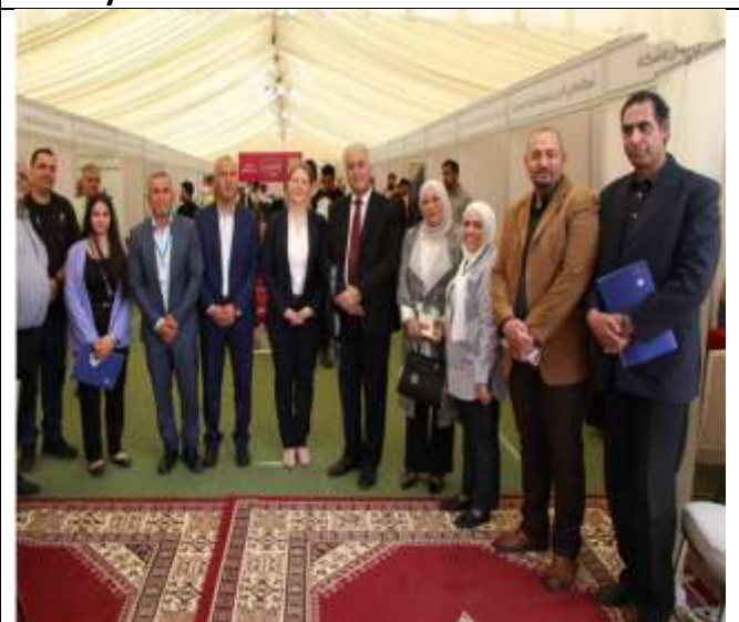
2 nd career day organized by the Zarqa Chamber of Industry.