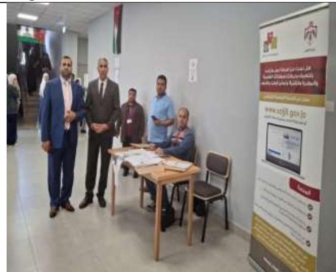
National Employment Day 2025