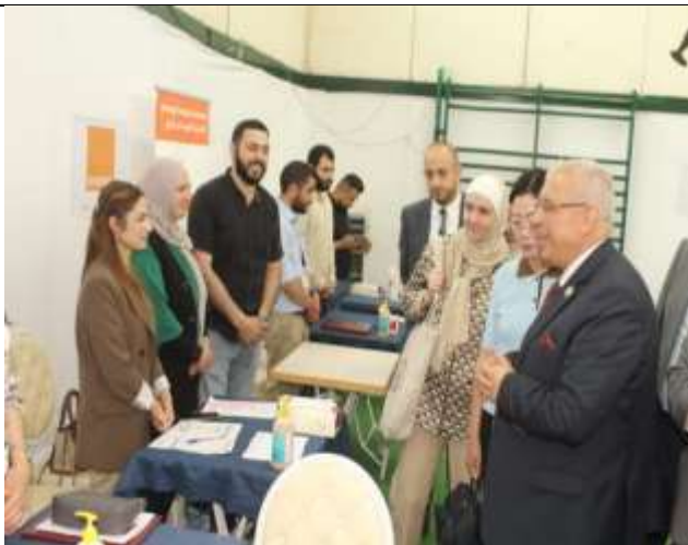
A career day