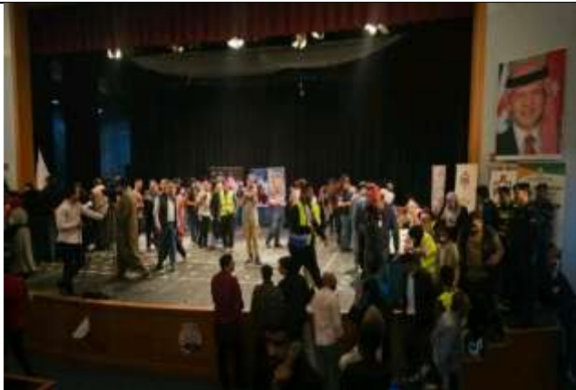
Ma'an University College graduates participate in the 2025 National Employment Day in Ma'an Governorate.