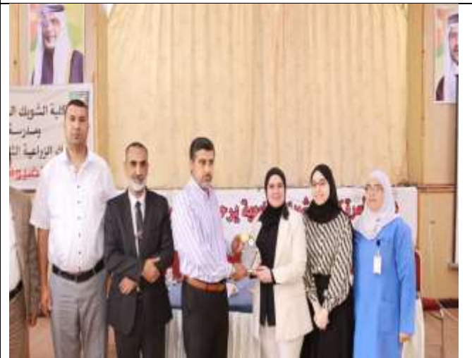
Medical Awareness Day