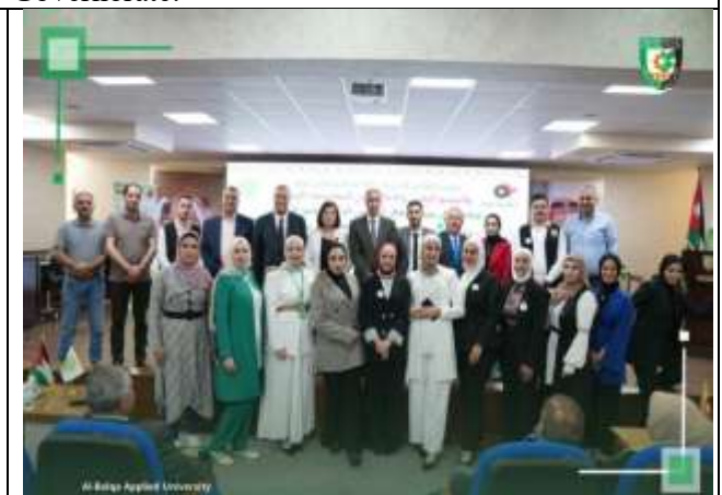
Conference on Launching Social and Development Services and Digital and Media Expansion in Rural Communities