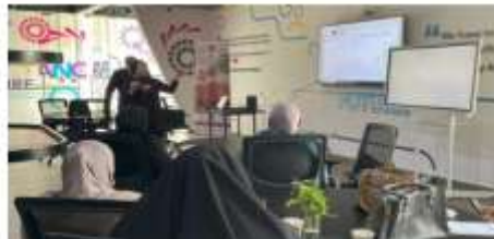
Sample of Training Activities for Local Community Women

The INTERNISA training took place in the Zaur incubator in Salt for 25 women, who have owned their small workshops or retail shops in the area.