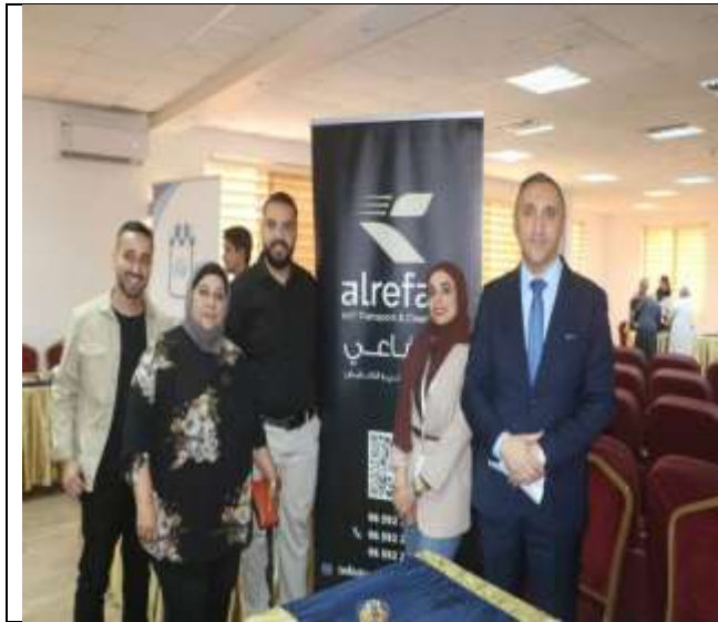
Career and scientific day