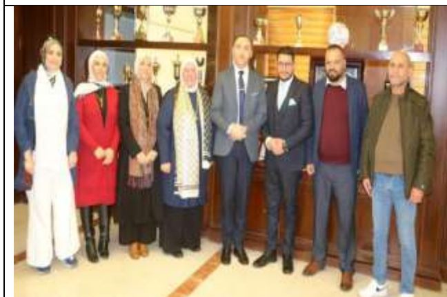
MoU with Burj Al Arab Clearance Company