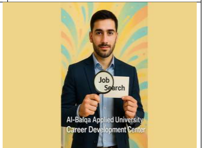
Hand in Hand Initiative towards the Labor Market 20th batch