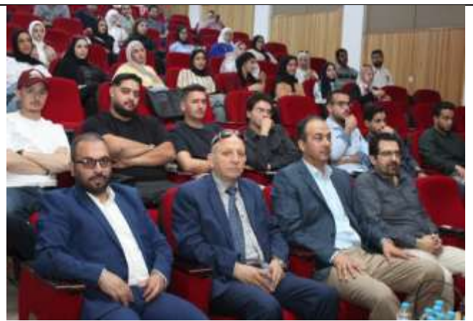
Scientific day as part of the Graduates Week activities