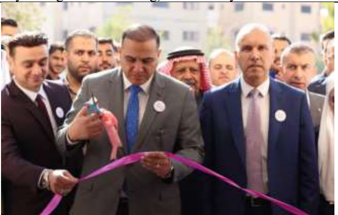
Healthy Patterns Event