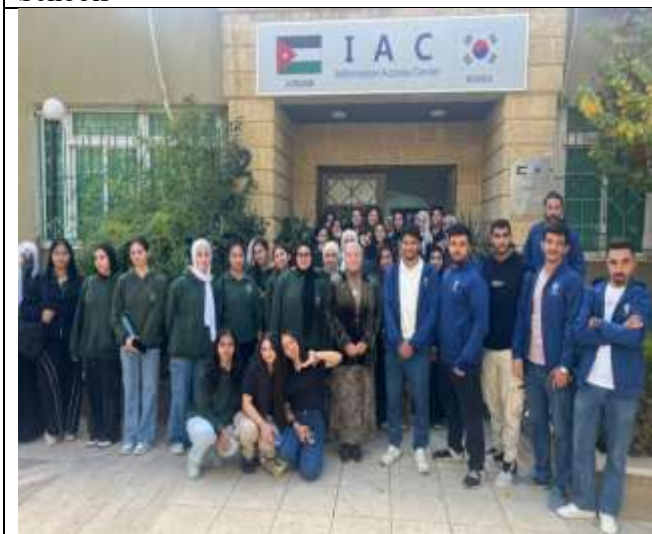
Training workshop on (Virtual Reality: Transferring Experiences to the Digital World) for school students