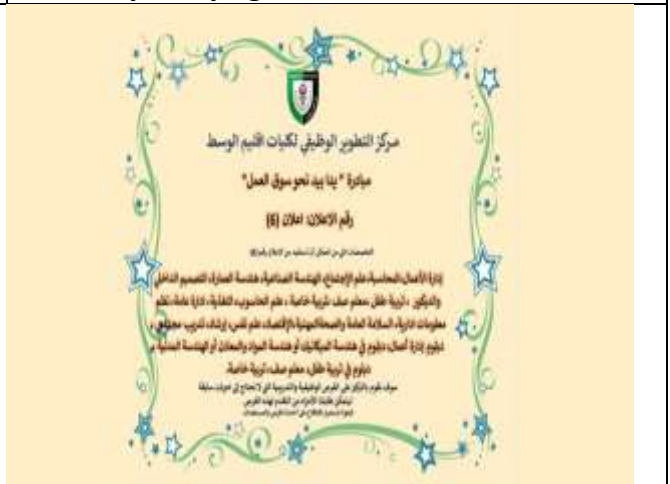
Hand in Hand Initiative towards the Labor Market 6th batch