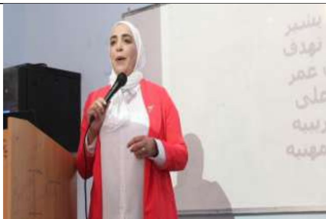
Career Day as part of Graduate Week