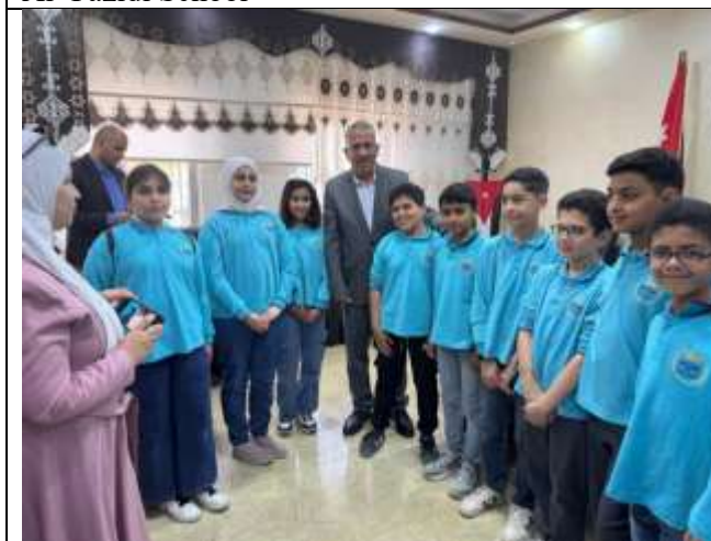
Ajyal Al Mamlaka School visits Karak University College