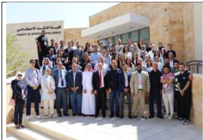
A delegation from the 19th Arab Capitals Youth Forum visits the College of Artificial Intelligence.