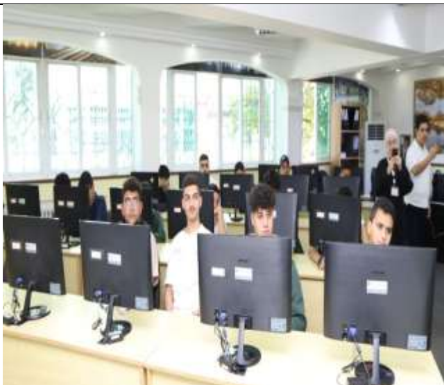
A Training Workshop on Robotics and 3D Printing for Students of Al-Madinah Al-Fadhilah School