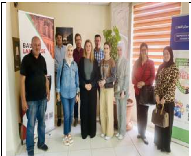
The 2nd Training Workshop In The RELO Workshop Series At The Language Center