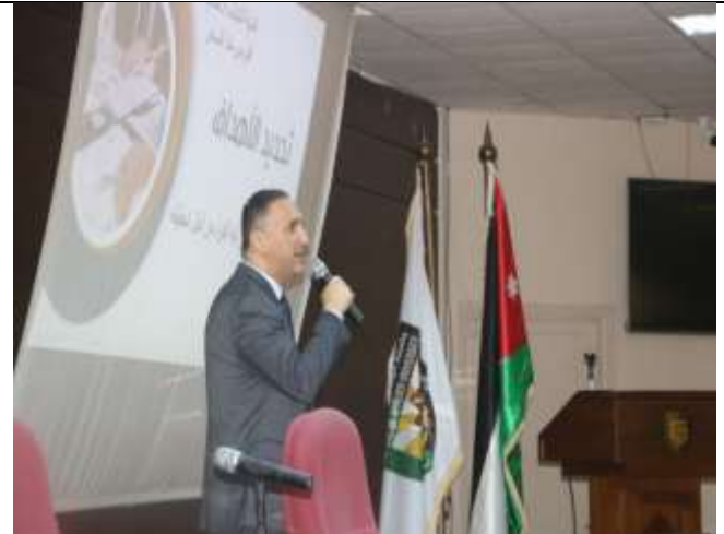
Training Workshop: Youth Development to Seize Opportunities from an Early Age