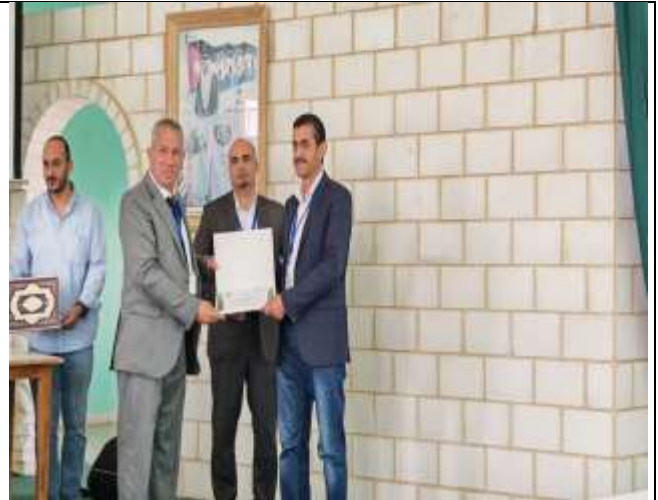
Career Day for Southern Region Colleges