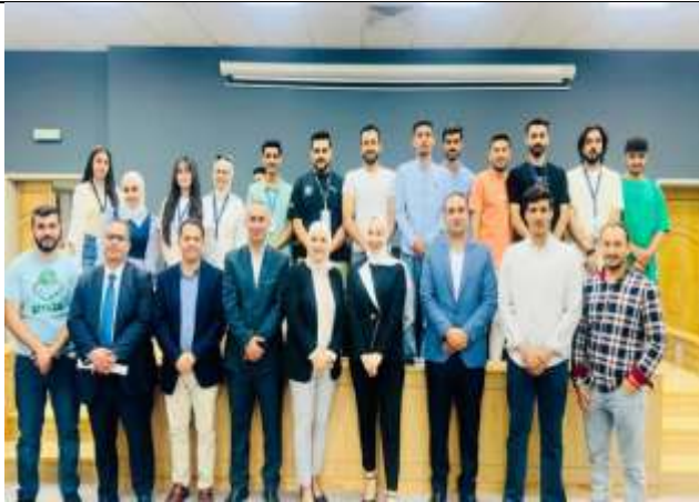
A Training Workshop for Enhance Graduates' Communication Skills In Preparation For The Job Market.