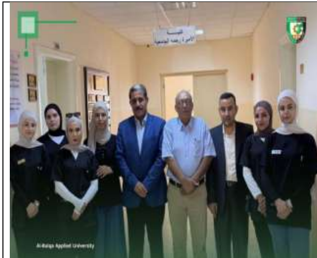
A Specialized Workshop on Psychological and Mental Diagnosis for Female Students of The Palestinian Delegation