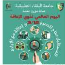
اليوم العالمي للتأهيل ذوي الإعاقة