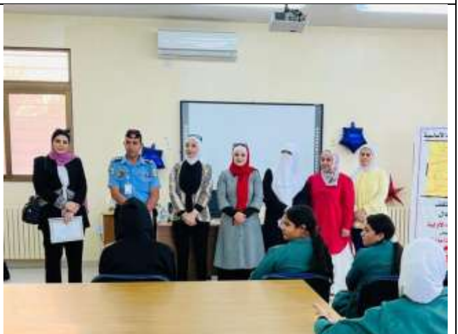
An Awareness lecture: (Cybercrimes) at Al Yarmouk School