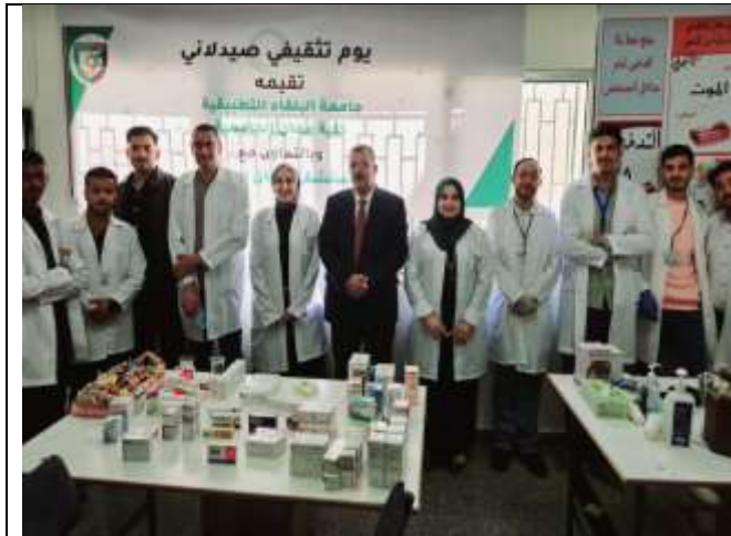
Pharmacist Education Day at Ma'an Governmental Hospital