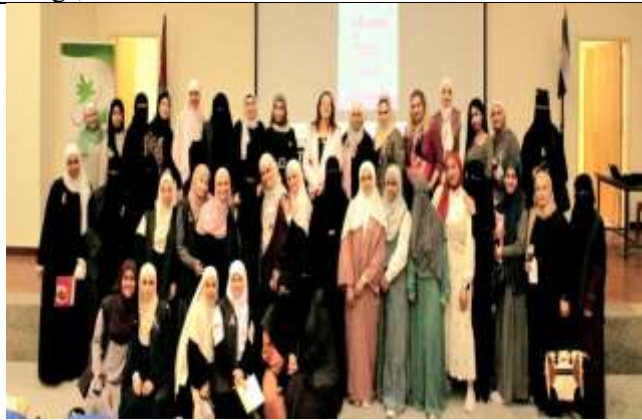
(Step Towards Life, Check) Activity