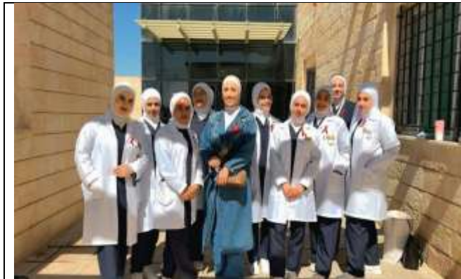
An Educational Workshop: April, Caesarean Section Awareness Month