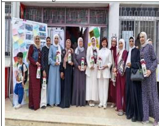
"I Am A Leader... I Am Responsible" Initiative at Al-Yazidi School