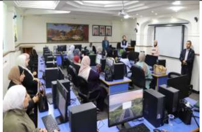
An innovative Training Course for Economic Empowerment of Female University Graduates