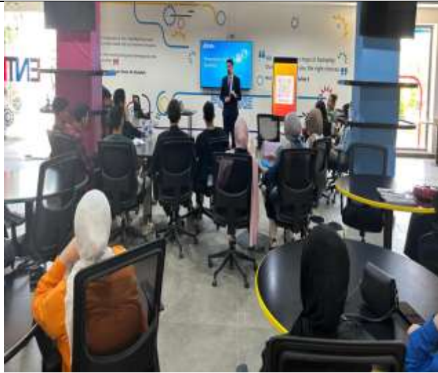
Training workshop entitled (Public Speaking and Presentation Skills)