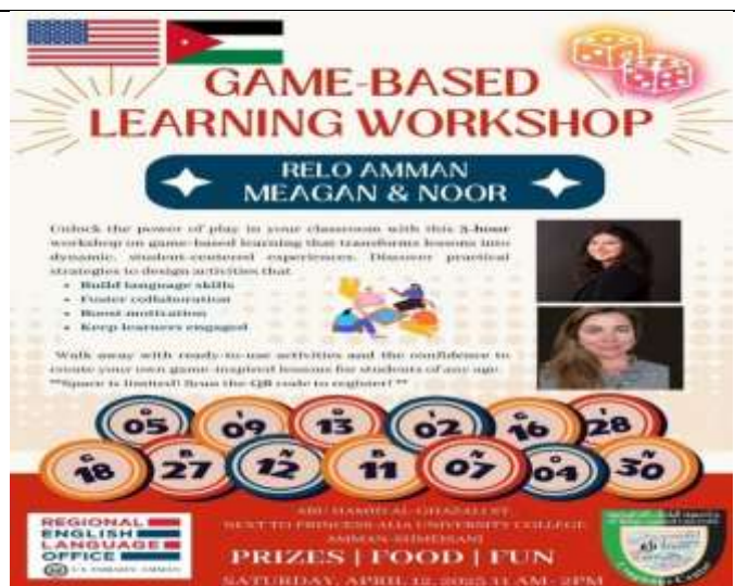
The 1st Workshop in the RELO Workshop Series