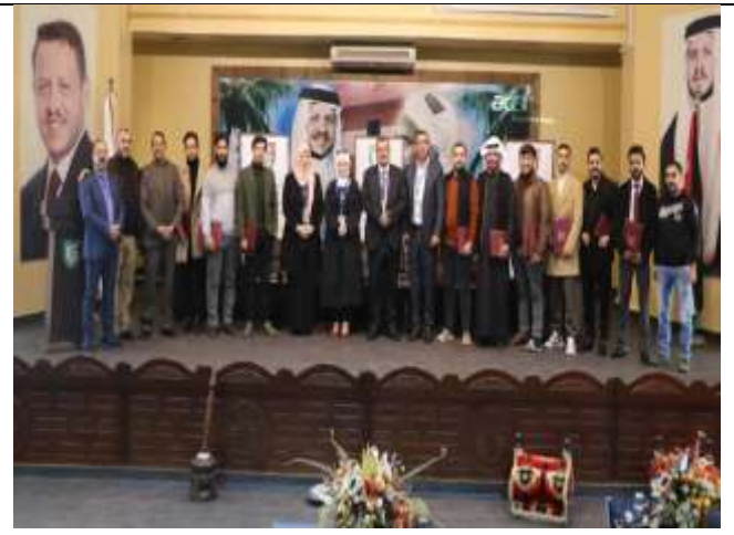
A scientific day at Ma'an College for Chemical Industries Technology