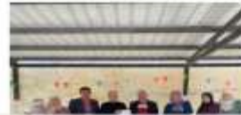
جائزة أفضل فريق تدريبي