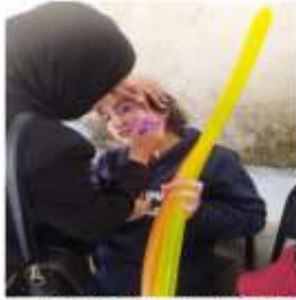
احتفالية داعمة بمناسبة اسبوع الطفل الصم