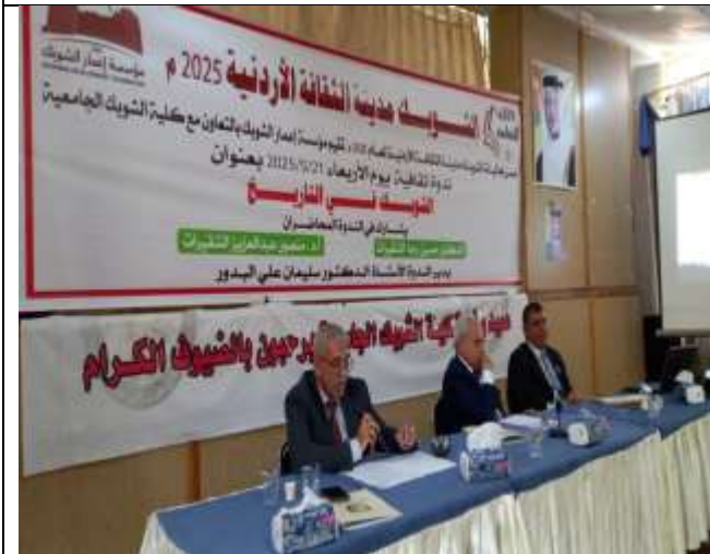
A Seminar Entitled "Shobak in History"