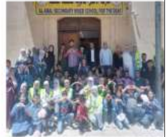
مشاركة في فعاليات اسبوع الطفل الصم العربي