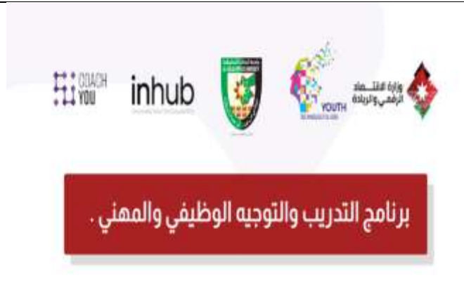
Career and Professional Training and Guidance Program