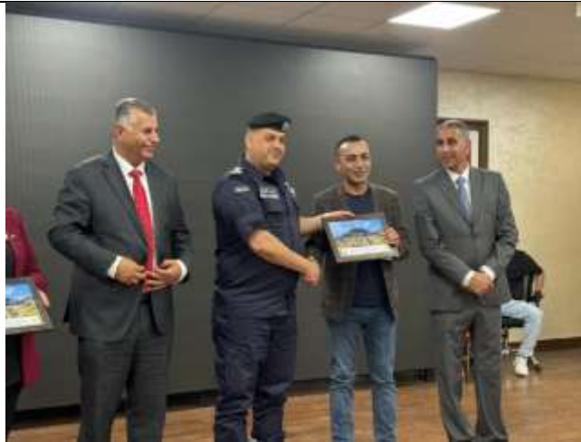
Anti-Drug Awareness Day Under the Slogan: No to Drugs, Yes to Life