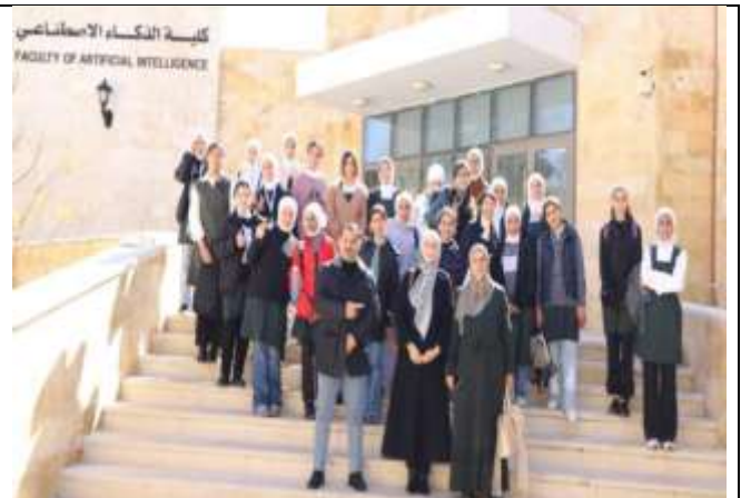
An introductory visit to the Faculty of AI for students of the King Abdullah II School for Excellence