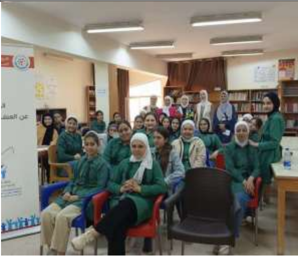
An awareness lecture : “Domestic Violence and Bullying” was held at Al-Balqa Comprehensive Secondary School for Girls.