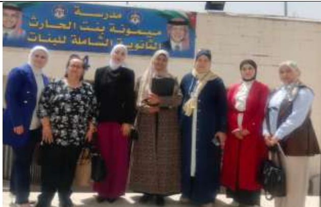
An awareness lecture: Causes, Effects, and Solutions to Violence and Bullying in Schools