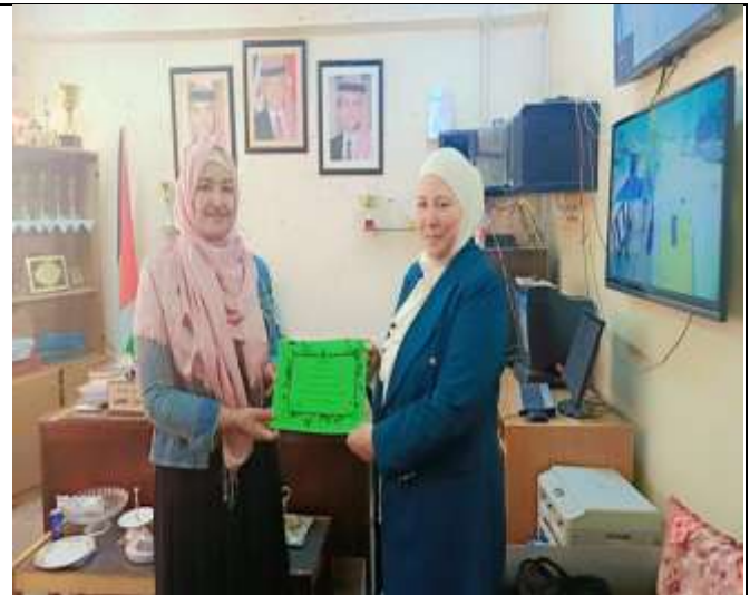
An Awareness Lecture About Adolescence at Al-Hasna Bint Muawiyah School