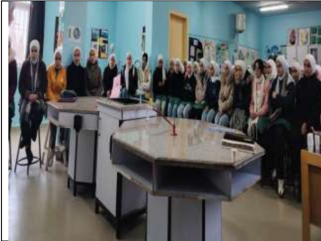
An Educational Workshop on the Safe Use of Medications and Oral and Dental Health Care During Ramadan.