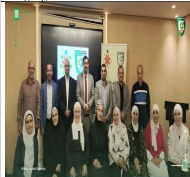
Specialized Course in Financing and Financial Planning for Innovative Environmental Projects