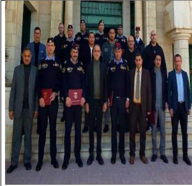
Statistical analysis course