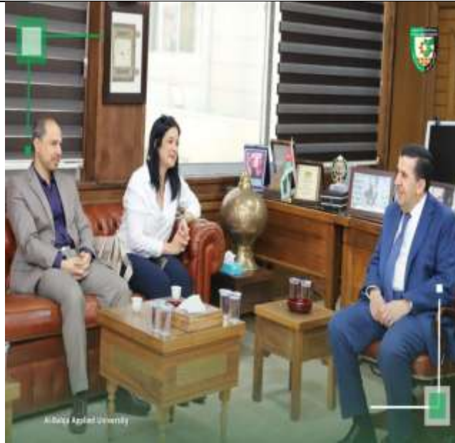
A series of training programs for engineers and operators of the Ministry of Water and Irrigation