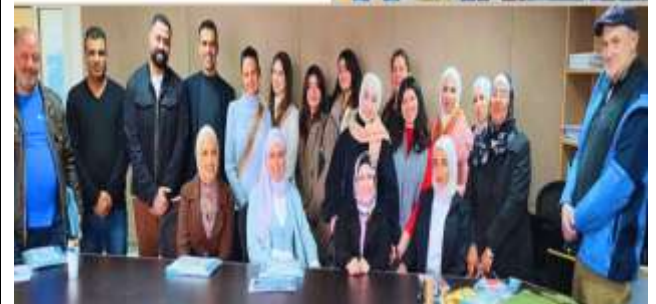
The first workshop in the RELO workshop series