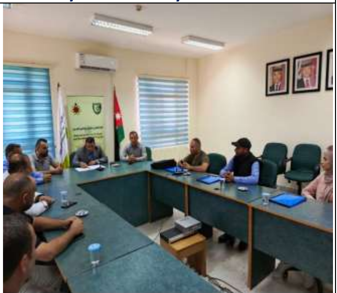
Montage art course