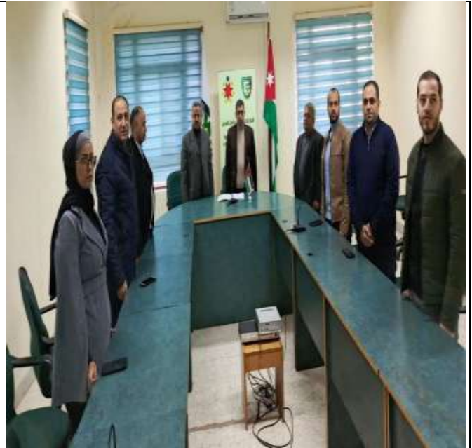
Power System Stability Course