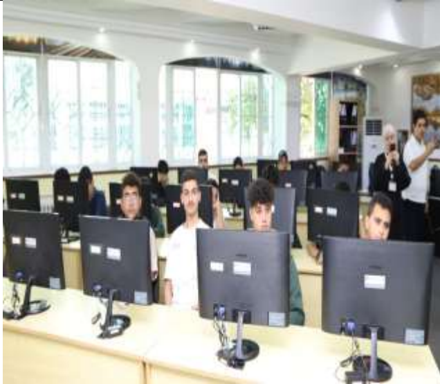
Training workshop on robotics and 3D printing