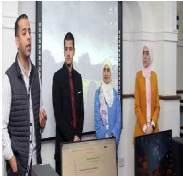
Specialized training workshop on (Employing Virtual Reality Technologies in Tourism)