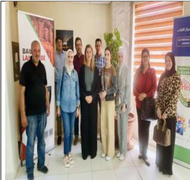
The 2nd Training Workshop In The RELO Workshop Series At The Language Center