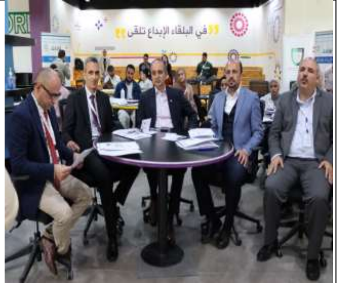
Balqa Green Innovation Hackathon 2025 Training Workshops