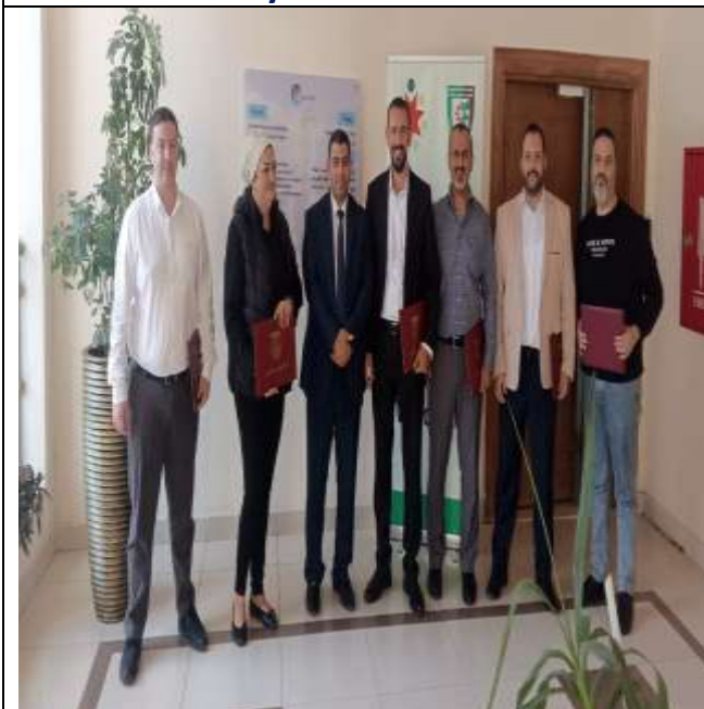
Strategic Procurement Management Course