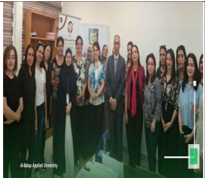
Training workshop entitled (The Digital Teacher and E-Learning: Integration for Quality Education)