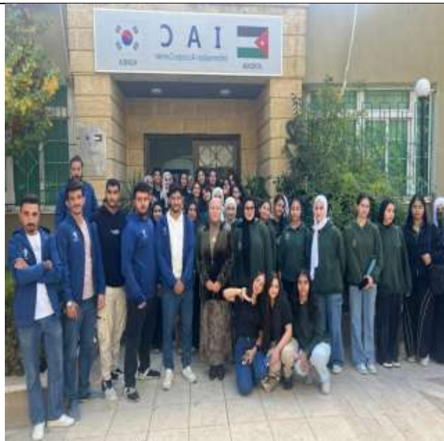
Training workshop on (Virtual Reality: Transferring Experiences to the Digital World)