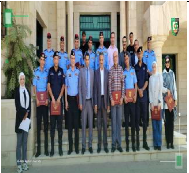
Specialized course on (The role of artificial intelligence in analyzing traffic accident data)