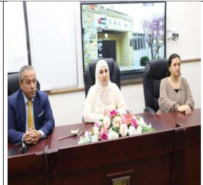
Training workshop on artificial intelligence and female entrepreneurship