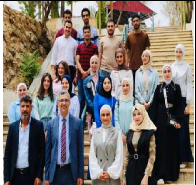
Career and Professional Training and Guidance Program